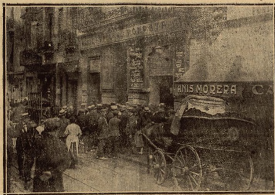
PUERTA DE LA CALLE DEL CONDE DEL ASALTO, POR LA QUE SALIO LA MAYORIA DE LOS HERIDOS