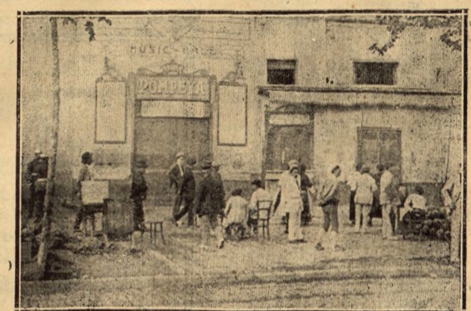
PUERTA PRINCIPAL DEL MUSIC-HALL, CON FACHADA AL PARALELO