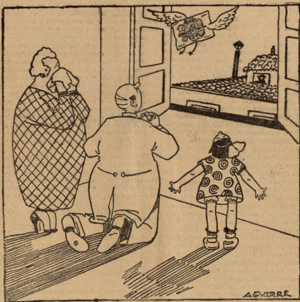
EFECTO CURIOSO PRODUCIDO EN UNA FAMILIA PARLAMENTARIA POR EL DECRETO DE DISOLUCION DE CORTES