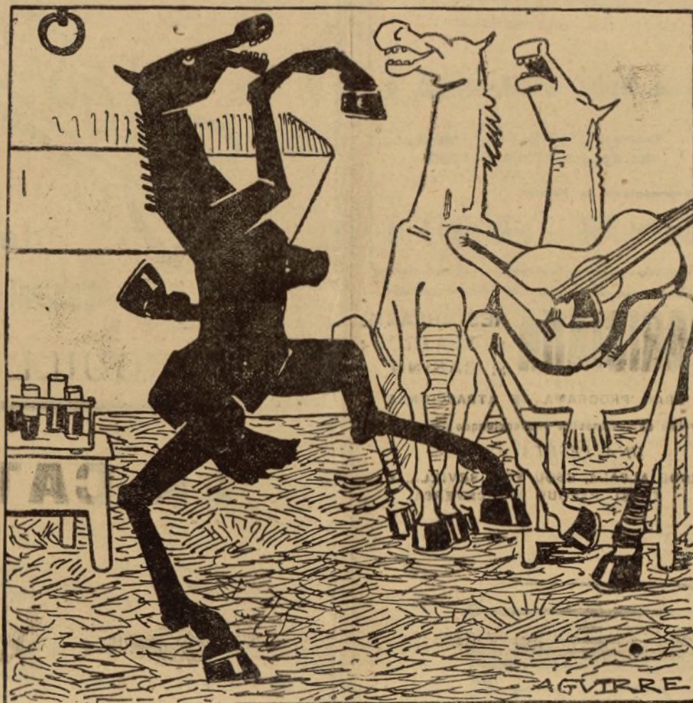
Los únicos interesados en celebrarla