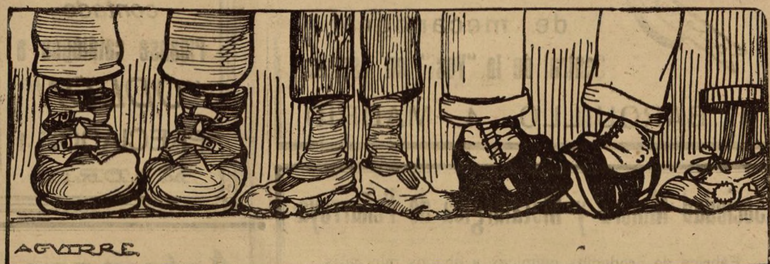
Bases que los huelguistas presentan a los patronos

en libertad los súbditos ingleses, empezaría la reanudación de las relaciones comerciales con Rusia.