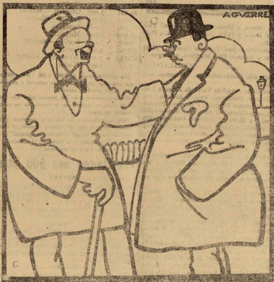
—Y SI QUIERES SALIR DIPUTADO, NADA DE MITINES NI DE DISCURSOS... ¡TALEGAS, TALEGAS Y TALEGAS!

Este, a pesar de estar herido, fustigó a la caballería, que emprendió veloz carrera