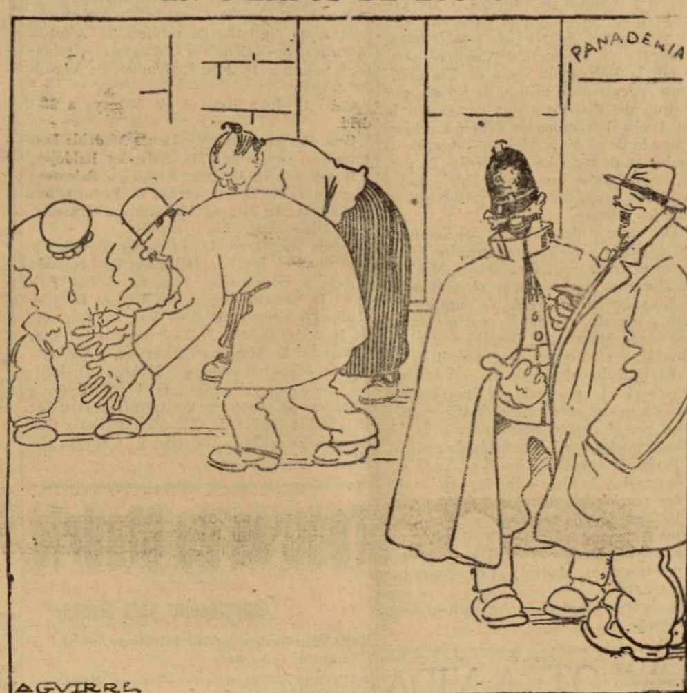
—¿QUE BUSCAN ESTAS GENTES, GUARDIA? —UN PANECILLO, QUE DICEN QUE SE LE HA CAIDO A UNO DE LA COLA.

Desde luego puede adelantarse que en el baluarte del Infante se verificarán diversos festejos en obsequio a los soldados.