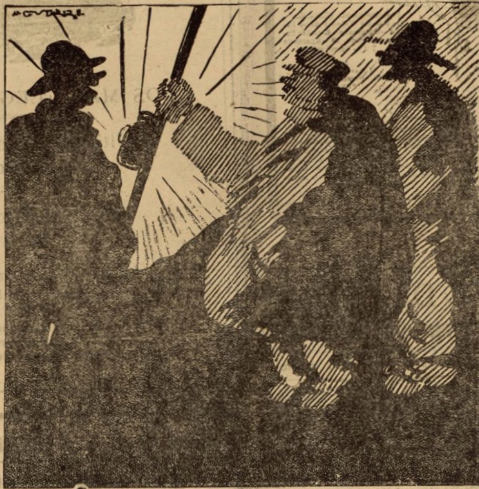
LOS FORASTEROS.—DIGA USTED, SERENO, ¿EN QUE PARTE DE MADRID NOS HALLAMOS? EL SERENO.—ESPEREN USTEDS QUE ALUMBRE... (Pausa). ¡ME PARECE QUE ESTAMOS EN LA PUERTA DEL SOL!