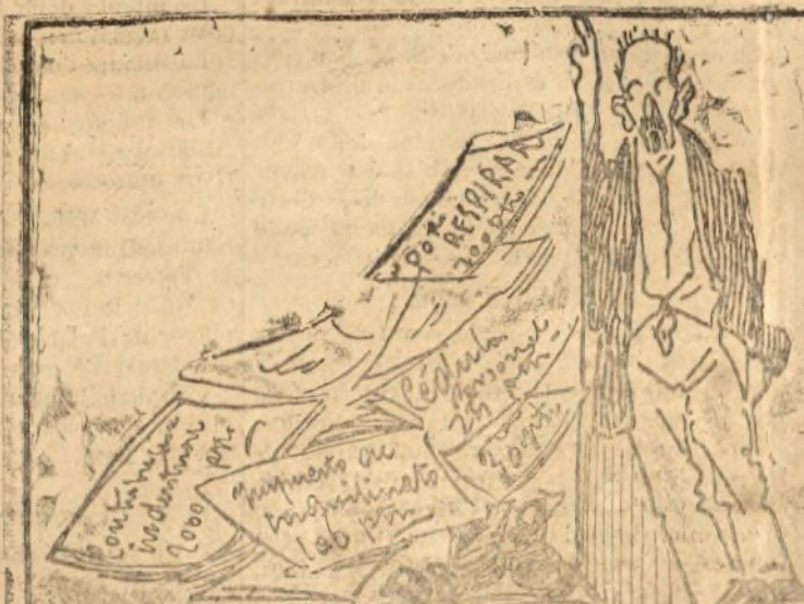
Al pobre contribuyente cargas hasta que revienta.