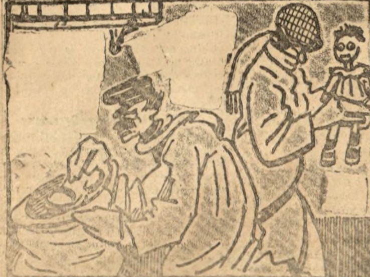
La asociación de mangantes hará sus negocios antes.