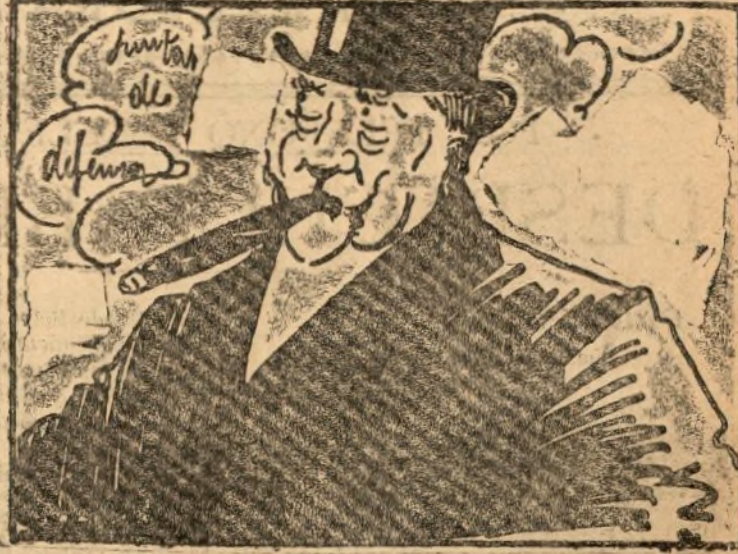
Al lende nna fagarnina de muy mala nicotina.