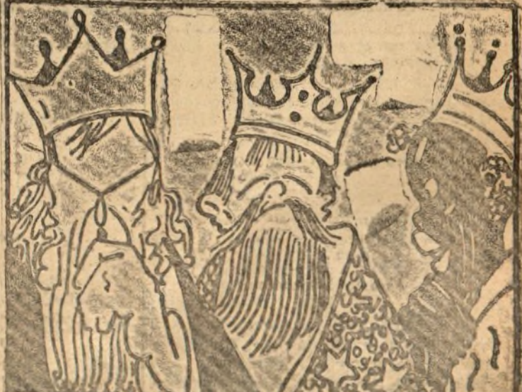
Los magos han cavillado pero en todo han acertado.