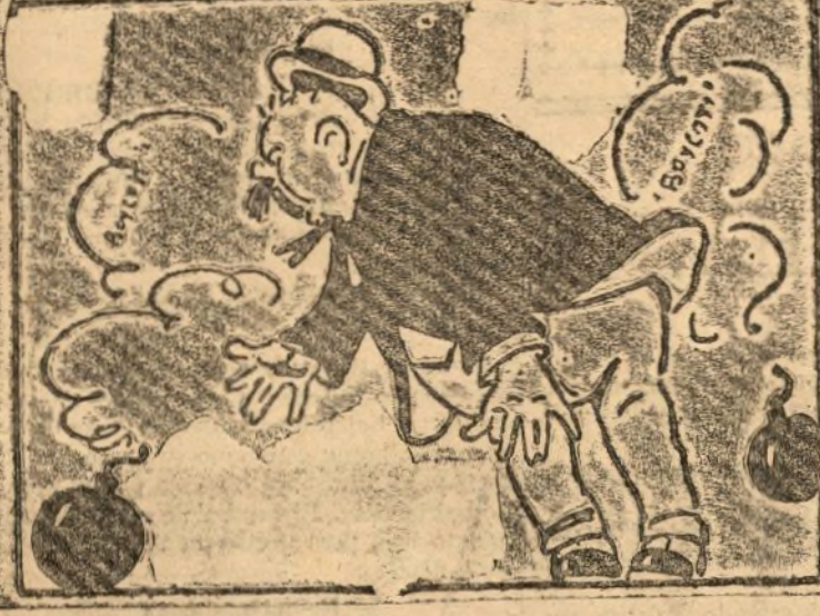
Al patrono danle un susio bombeándole a su gusto.