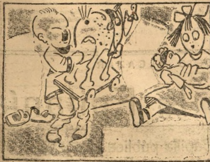
Uno caballo a Babieca y a la Coqui una muñeca.

Aleluyas de actualidad, por Lorenzo Aguirre