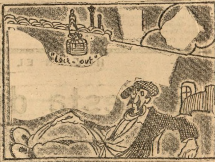
Al sindicalista obrero el cocido en el alero.