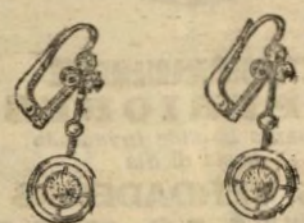
Pendientes, todo brillantes.