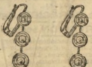
Pendiente, todo brillantes