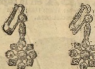
Pendientes brillantes y rosas