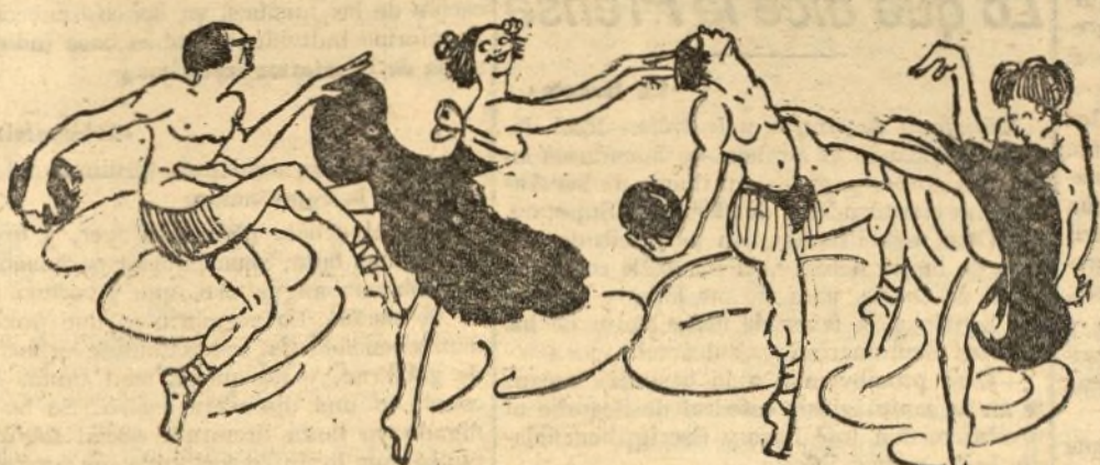
Los bailes rusos

Cierto que en algunos merenderos de los alrededores se bailan cosas regionales, como la jota, las seguidillas manchegas, la muñeira y el zorico. Pero eso no es de Madrid, y sólo se baila en las afueras. El Madrid de los castizos no baila eso. Antaño era otra cosa: la zarabanda, el vito, las caleseras, el zorongito y el bolero, eran cosas de neto matiz español; pero todo aquello desapareció con las últimas redécillas y