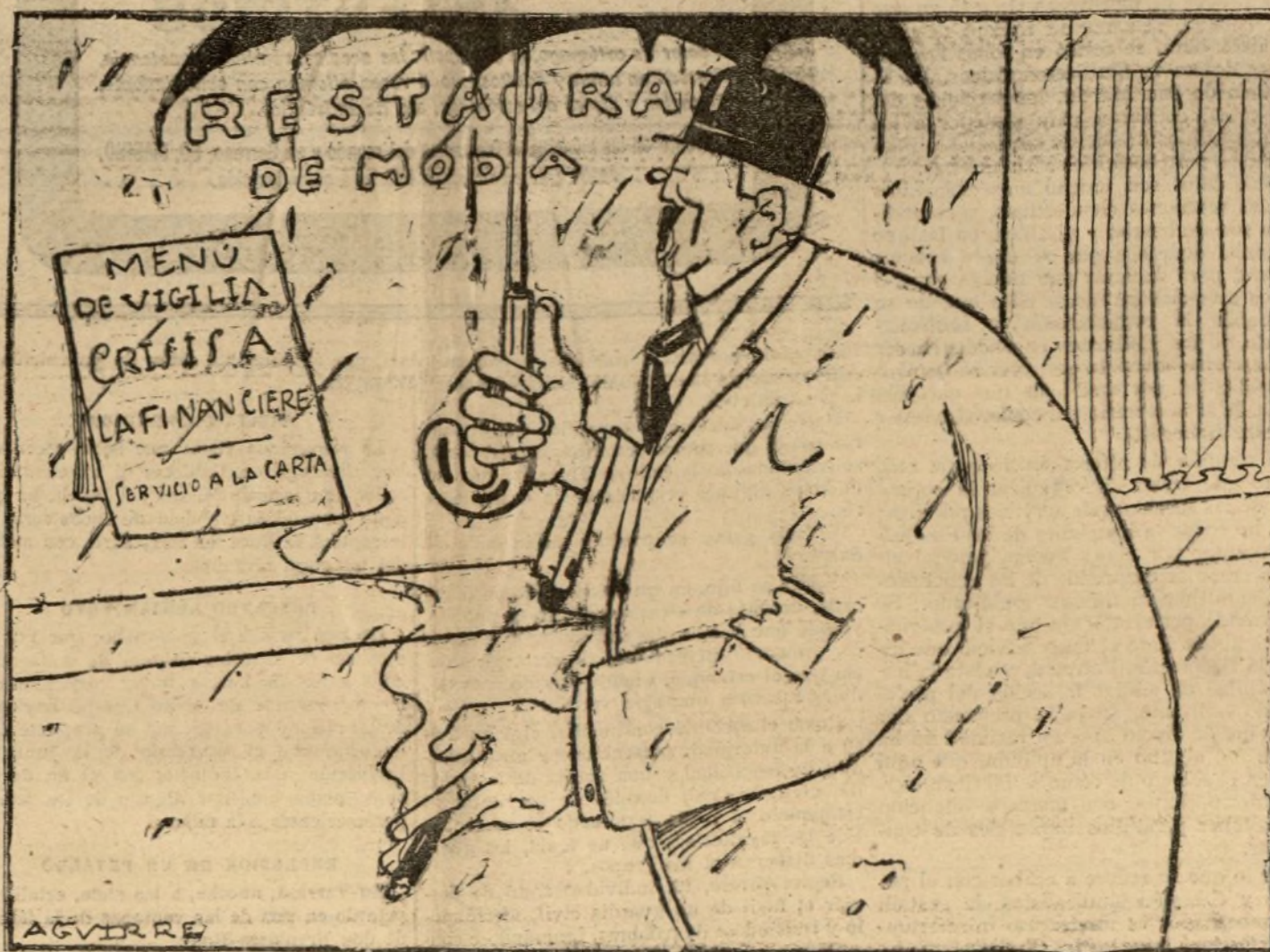
PLATO DEL DIA