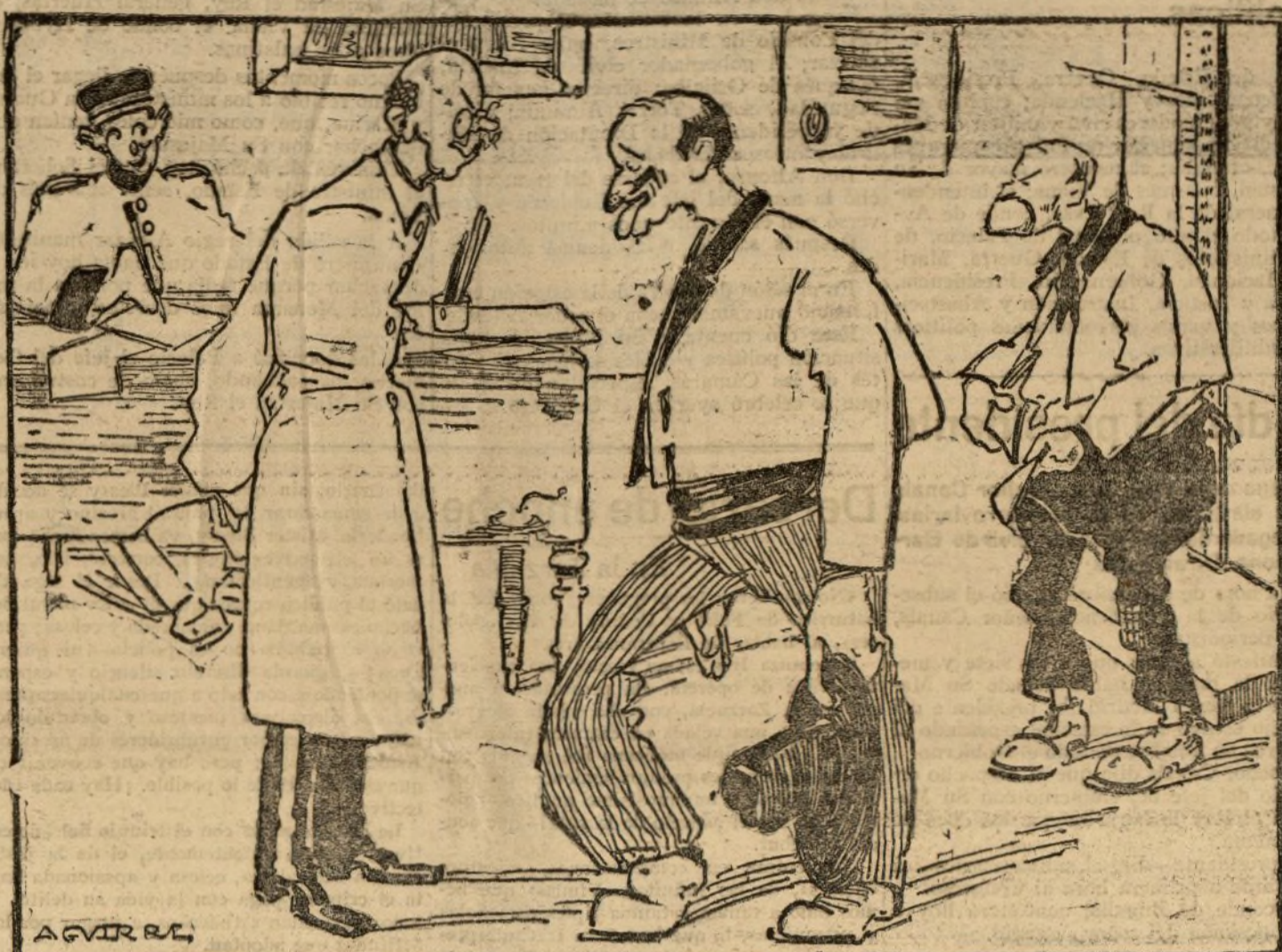
EL DOCTOR.—Bueno; escriba usted que esta par de mozos pueden ser considerados útiles...