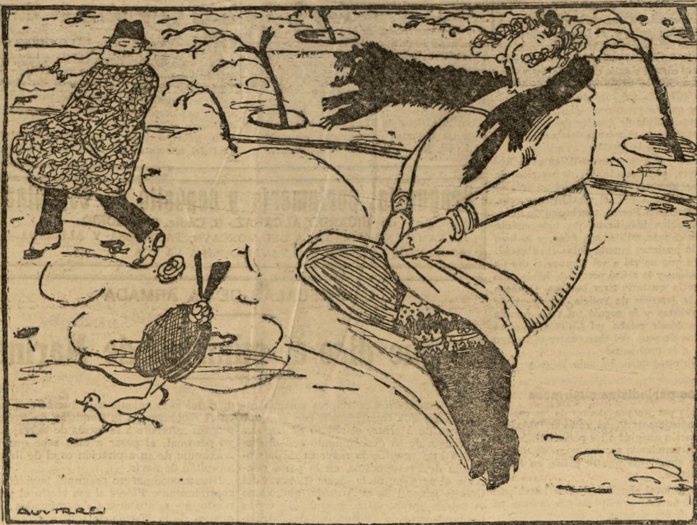
UNA SEÑORA COMPROMETIDA