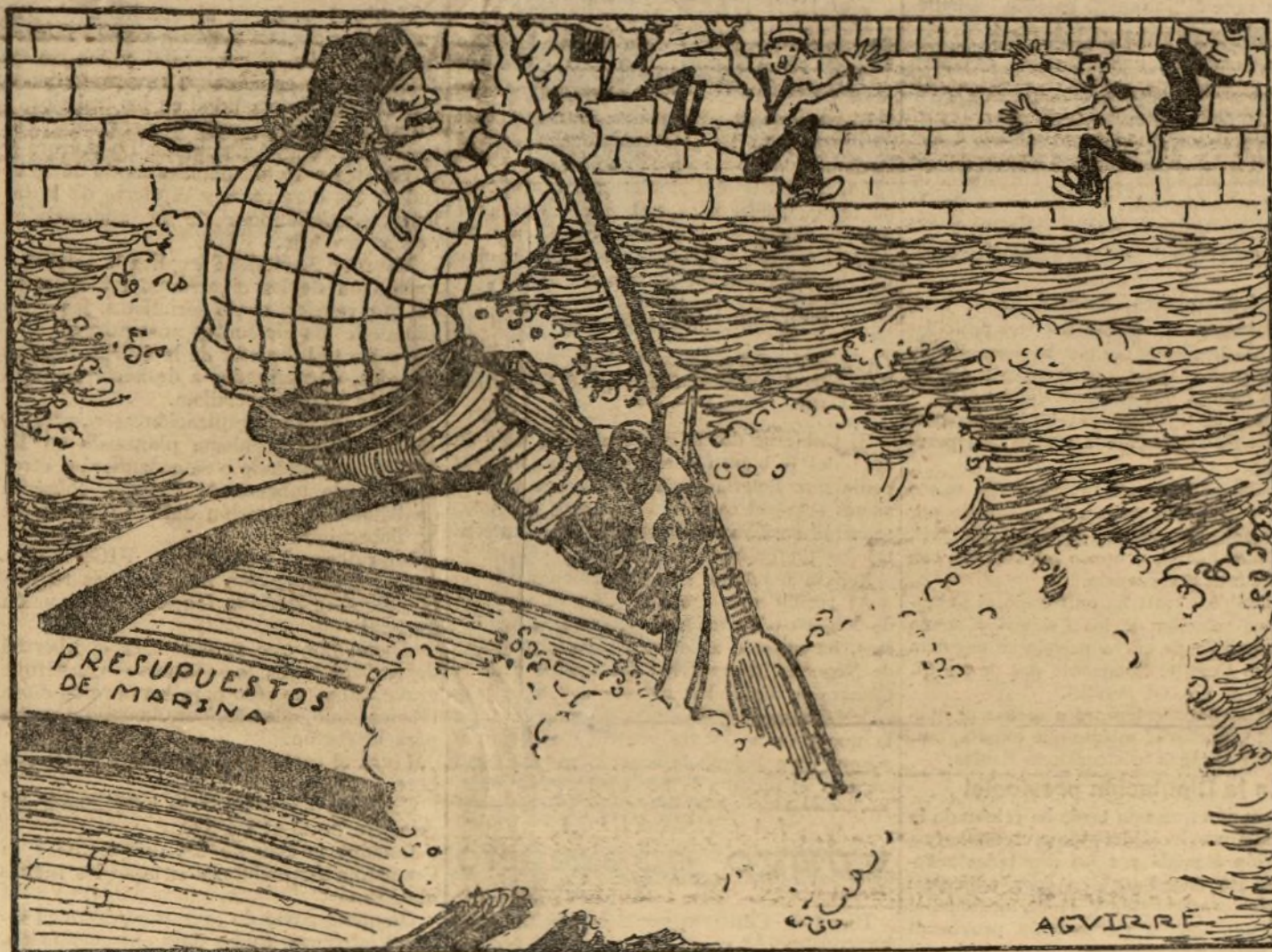
LOS DE LA ESCALA DE TIERRA.—¡Parece que S. E. mate mal ese remo!