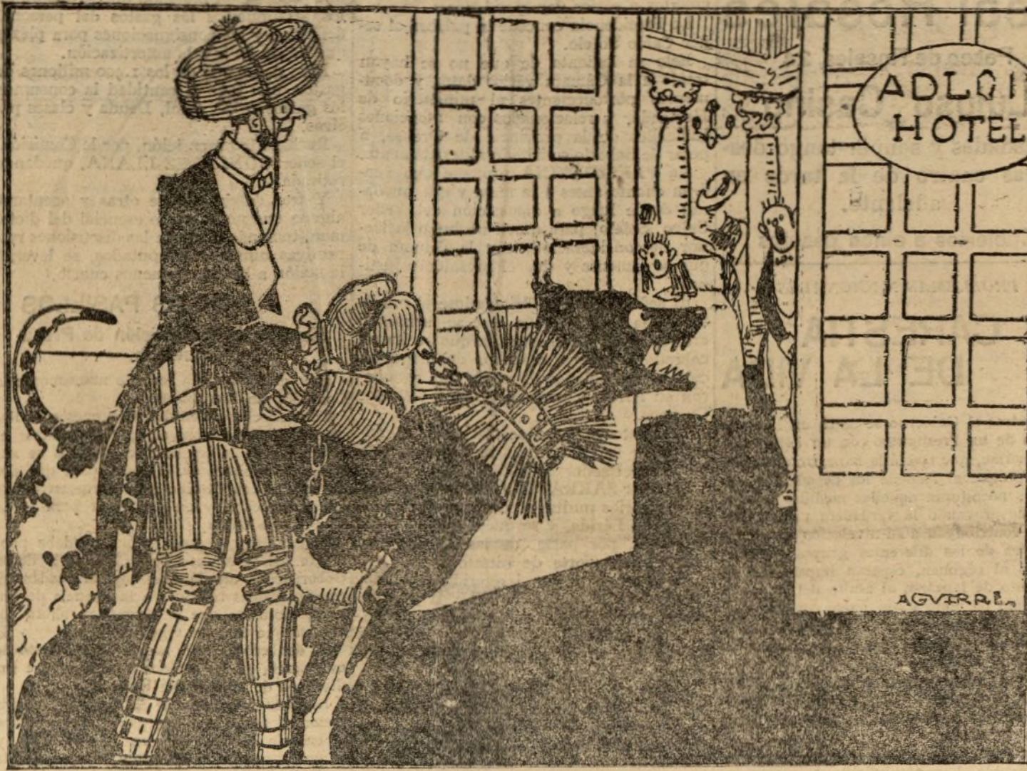
"Tenue" de poca ceremonia para asistir al té del Adlon Hotel.