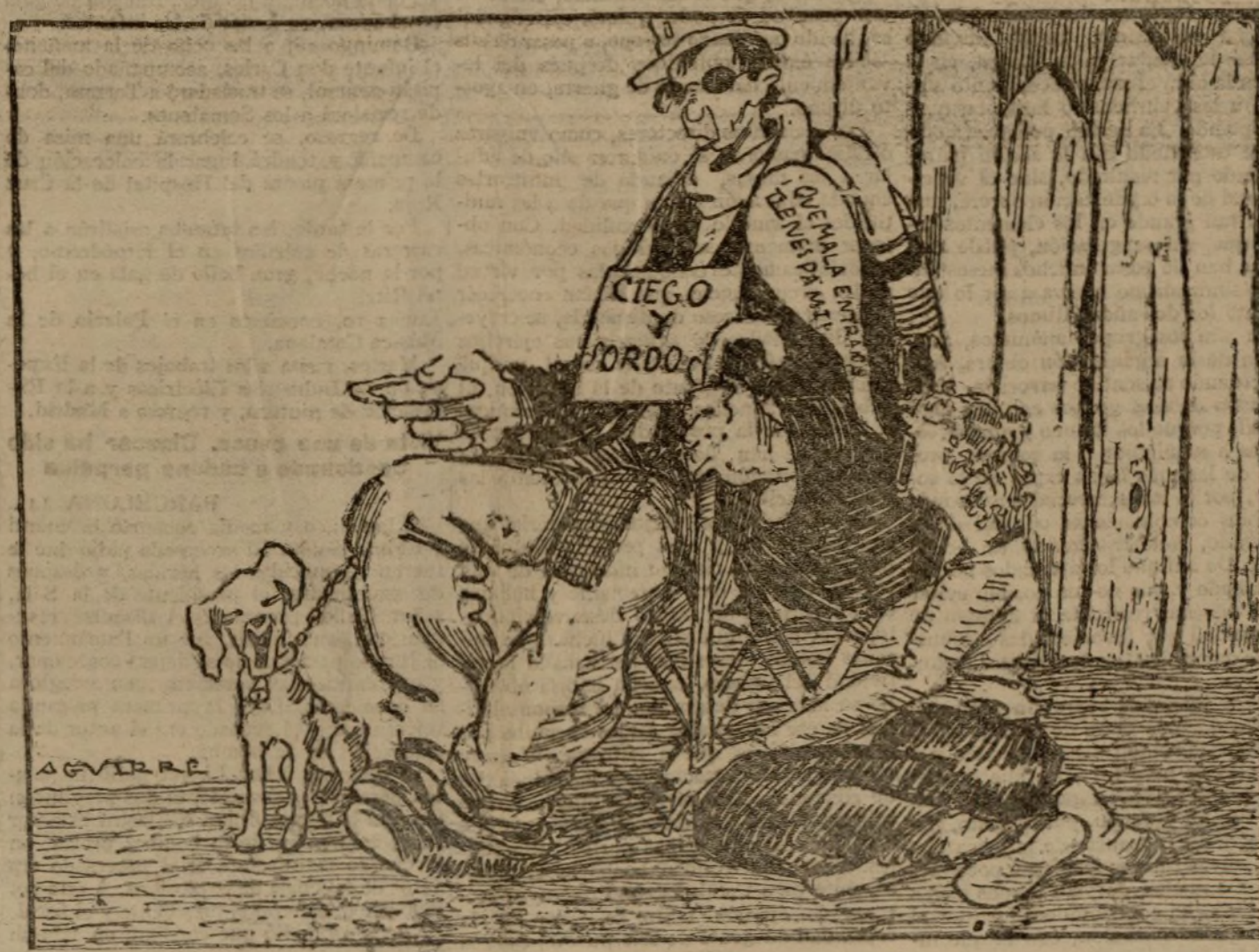
(EL CIEGO-SORDO) —... Y te advierto que como «vea» que «desafinas», te rebajo dos reales del jornal..