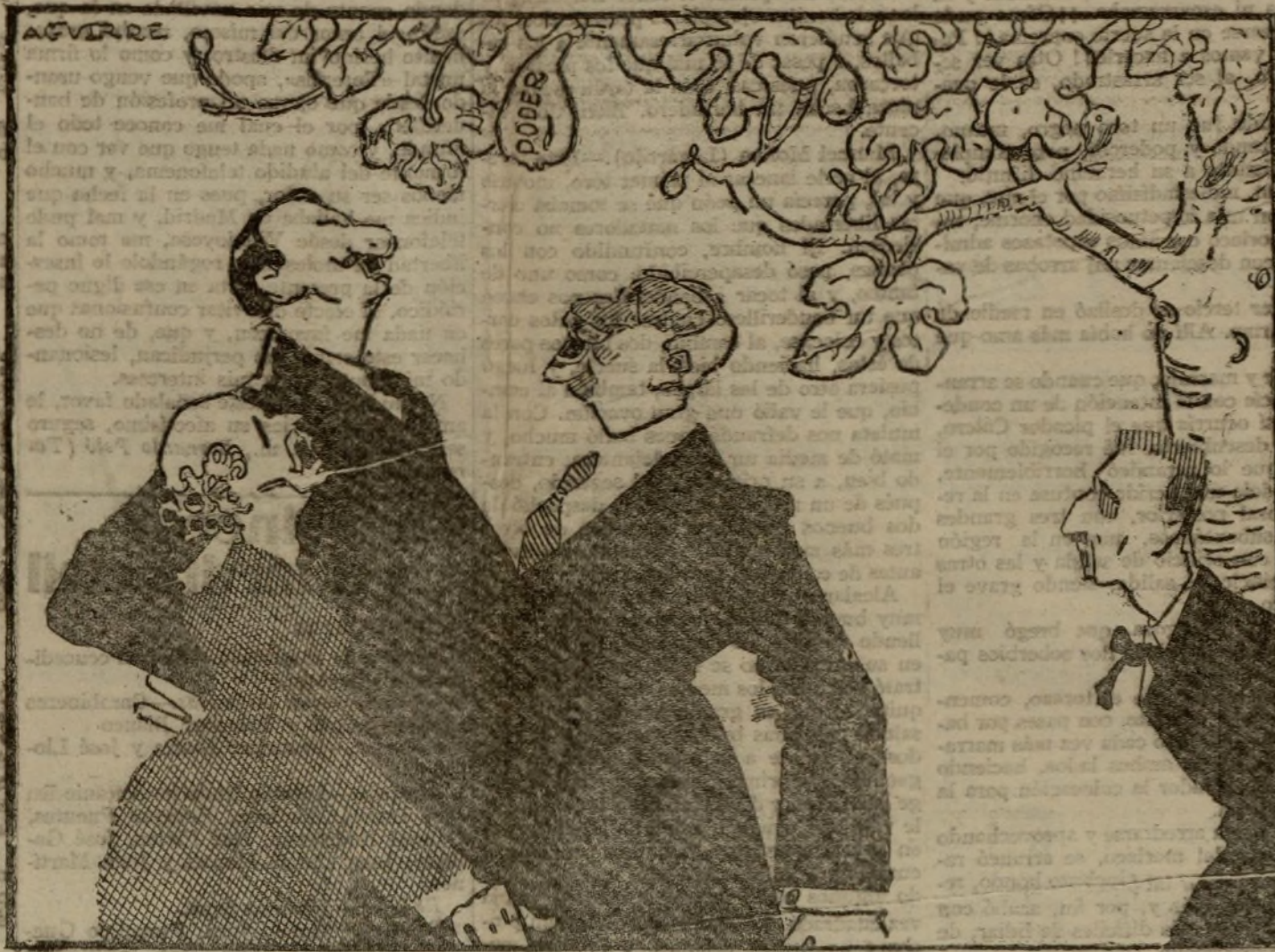
LO QUE AGUARDAN TODOS