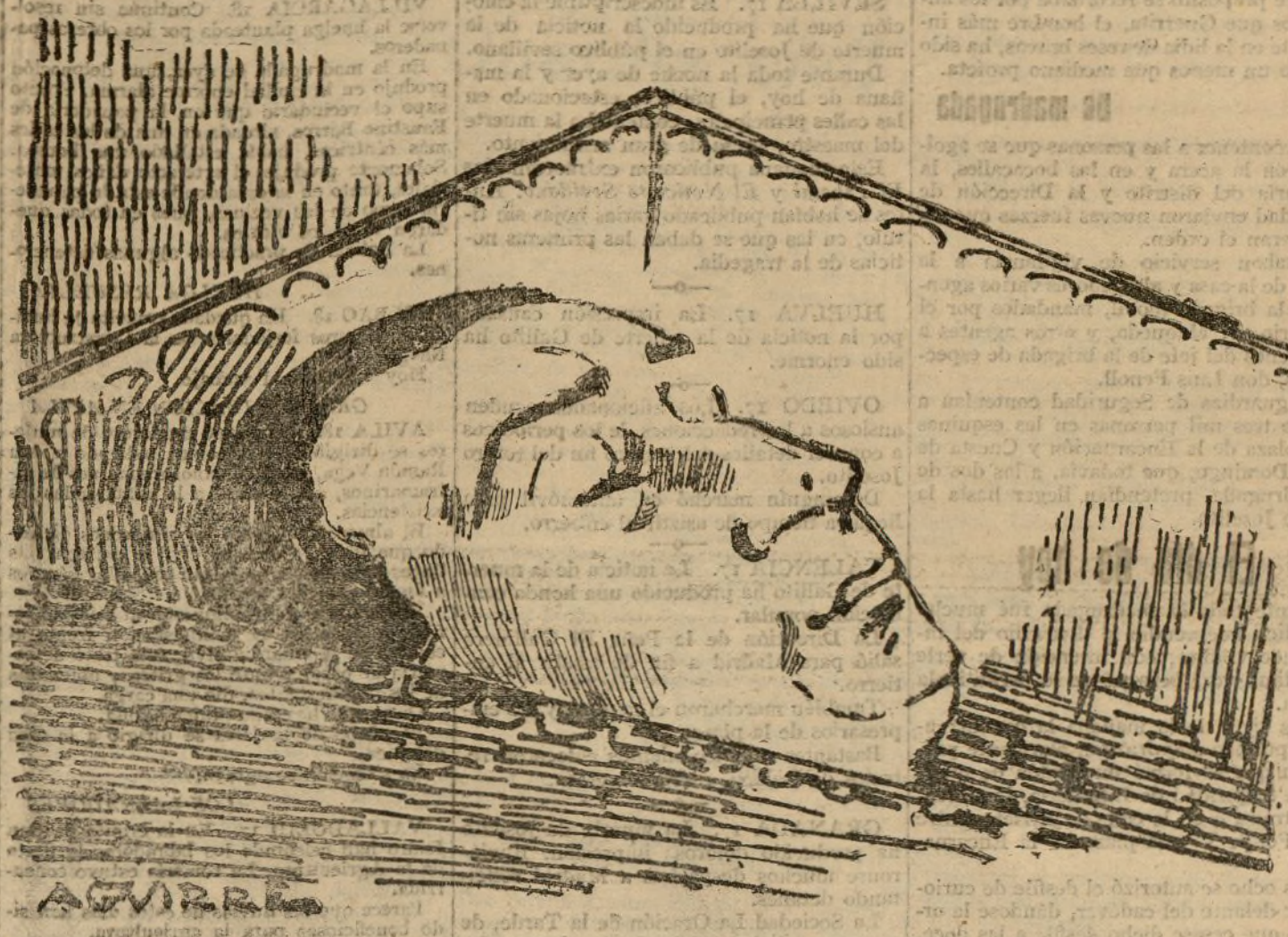
JOSELITO EN LA CAPILLA ARDIENTE (Apunte del natural por L. Aguirre)