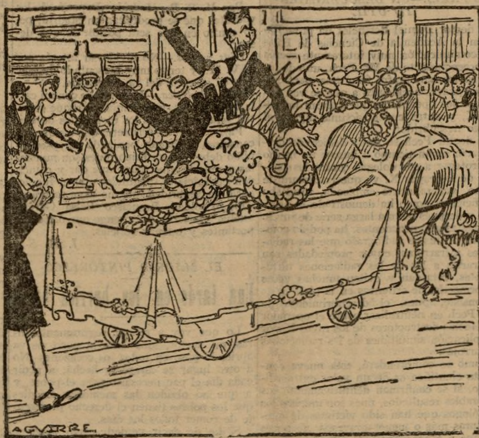
La Tarasca de Madrid