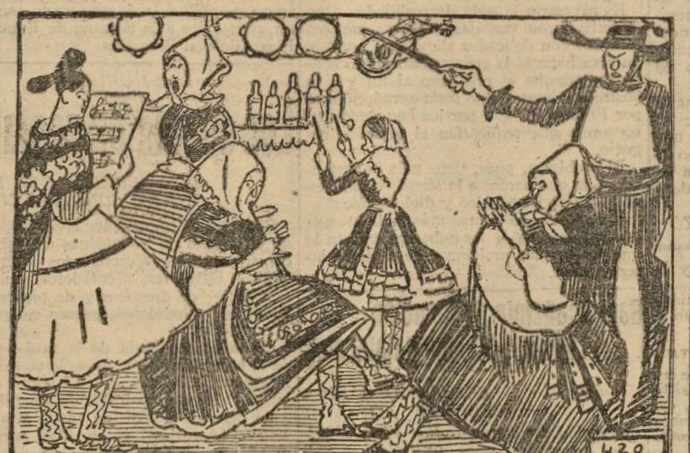
ZUBIAURRE.—El sexteto de Lagartera.