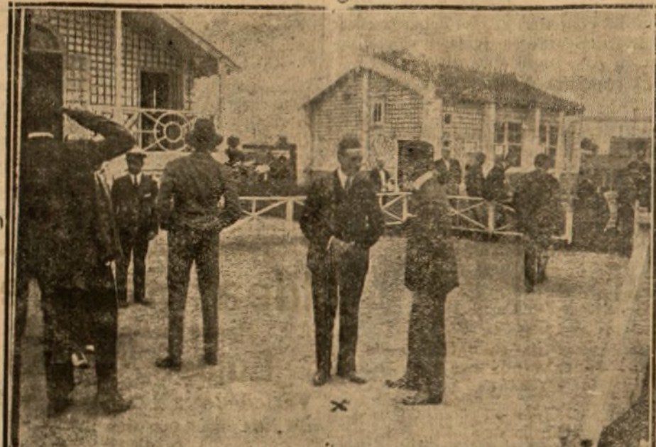
SU ALTEZA REAL EN INFANTE DON ALFONSO, QUE GANÓ LA COPA DE DON CARLOS EN EL TIRO DE PICHÓN.