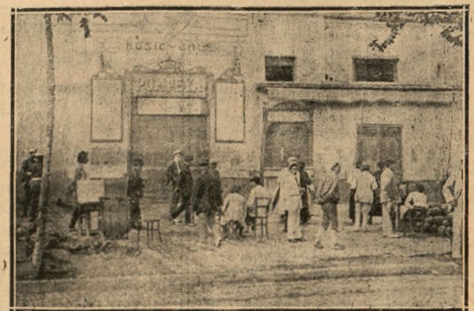
PUERTA PRINCIPAL DEL MUSIC-HALL, CON FACHADA AL PARALELO