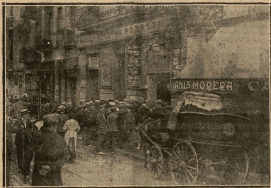
PUERTA DE LA CALLE DEL CONDE DEL ASALTO, POR LA QUE SALIO LA MAYORIA DE LOS HERIDOS