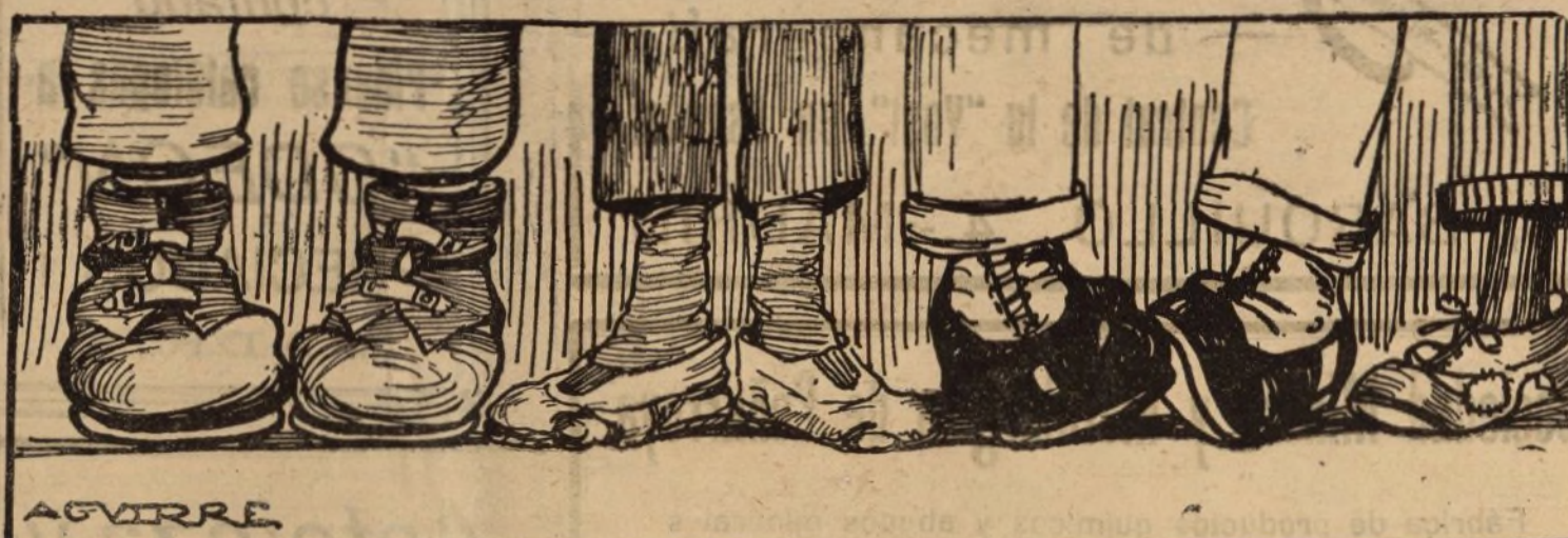
Bases que los huelguistas presentan a los patronos

en libertad los súbditos ingleses, empezaría la reanudación de las relaciones comerciales con Rusia.