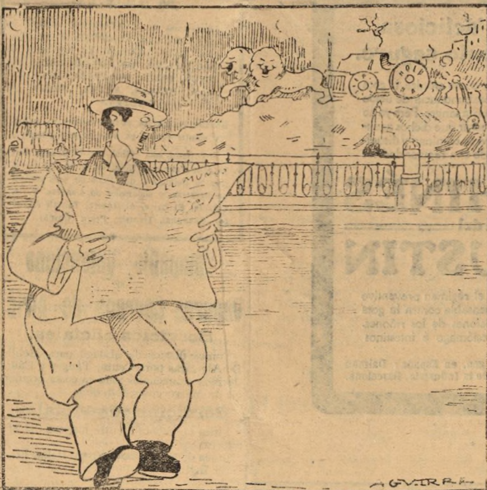
(Leyendo): «DESPUES DEL ROBO EN EL MUSEO Y DE LA SUSTRACCION DE LIBROS EN LA BIBLIOTECA NACIONAL, SE HABLA DE LA DESAPARICION DE UNA ILUSTRE DAMA DE LA EDAD DE PIEDRA, ARREBATADA POR UN ADOADOR DE LA CLASE DE CHAMARILEROS...»