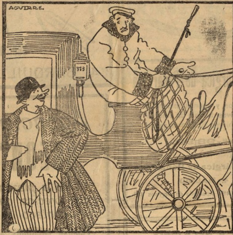
EL AURIGA.—PERO, ¿NO ME DA USTED PROPINA? EL PASAJERO.—¿ANDA CON DIOS, Y BUSCATELA POR OTRO «LAO»!