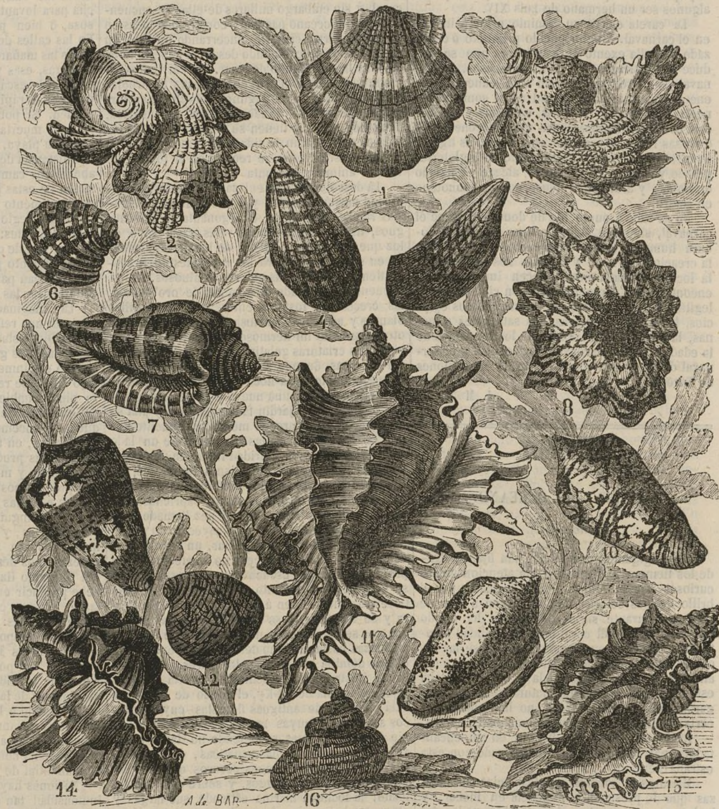
Conchas y vegetaciones en el fondo del mar.

Un joven que tenía muy mala cabeza y era