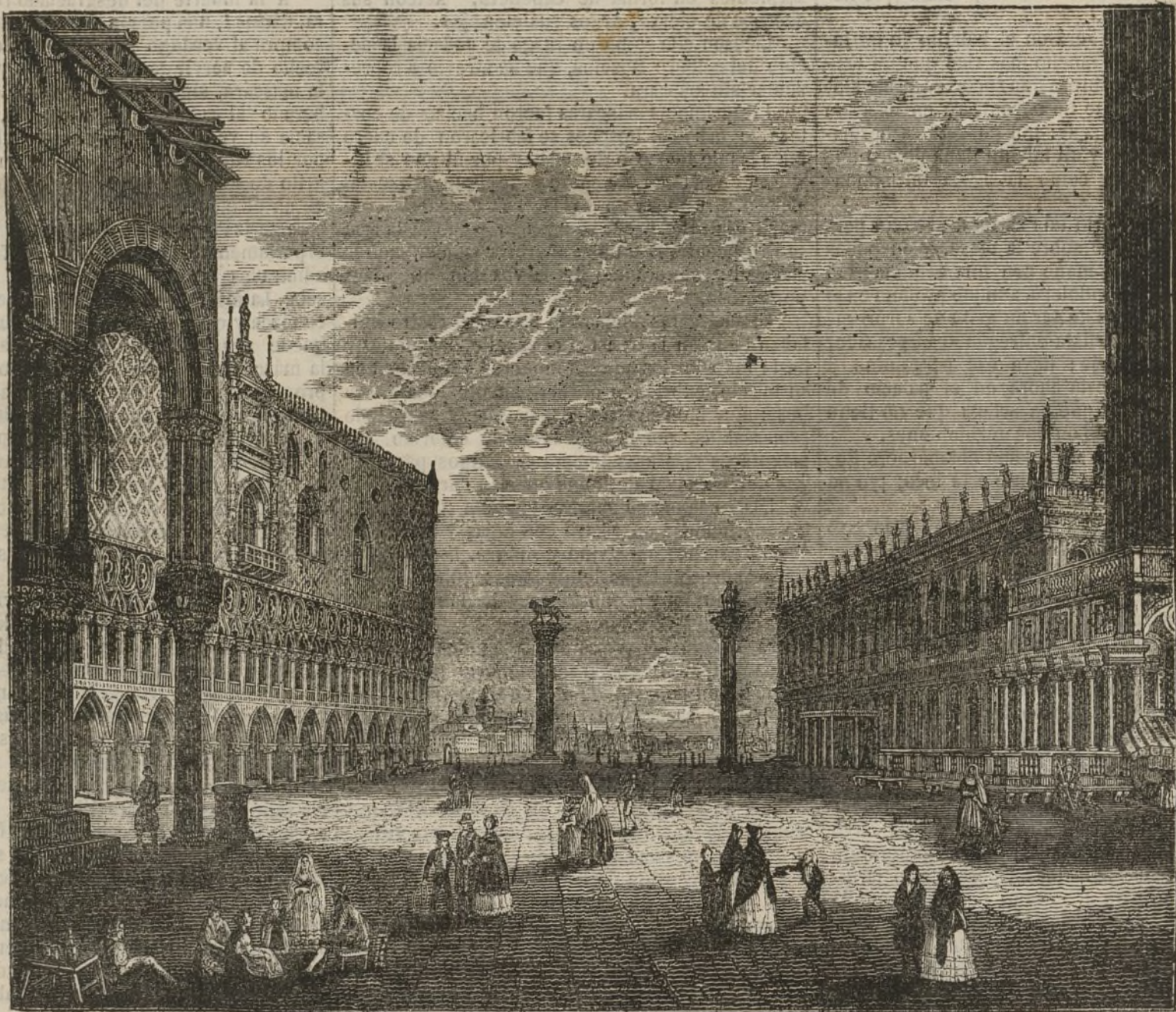
Plaza de San Marcos en Venecia.

—Porque para tres hombres favorecidos del cielo, hay millones desdenados, Barbarigo. Lo