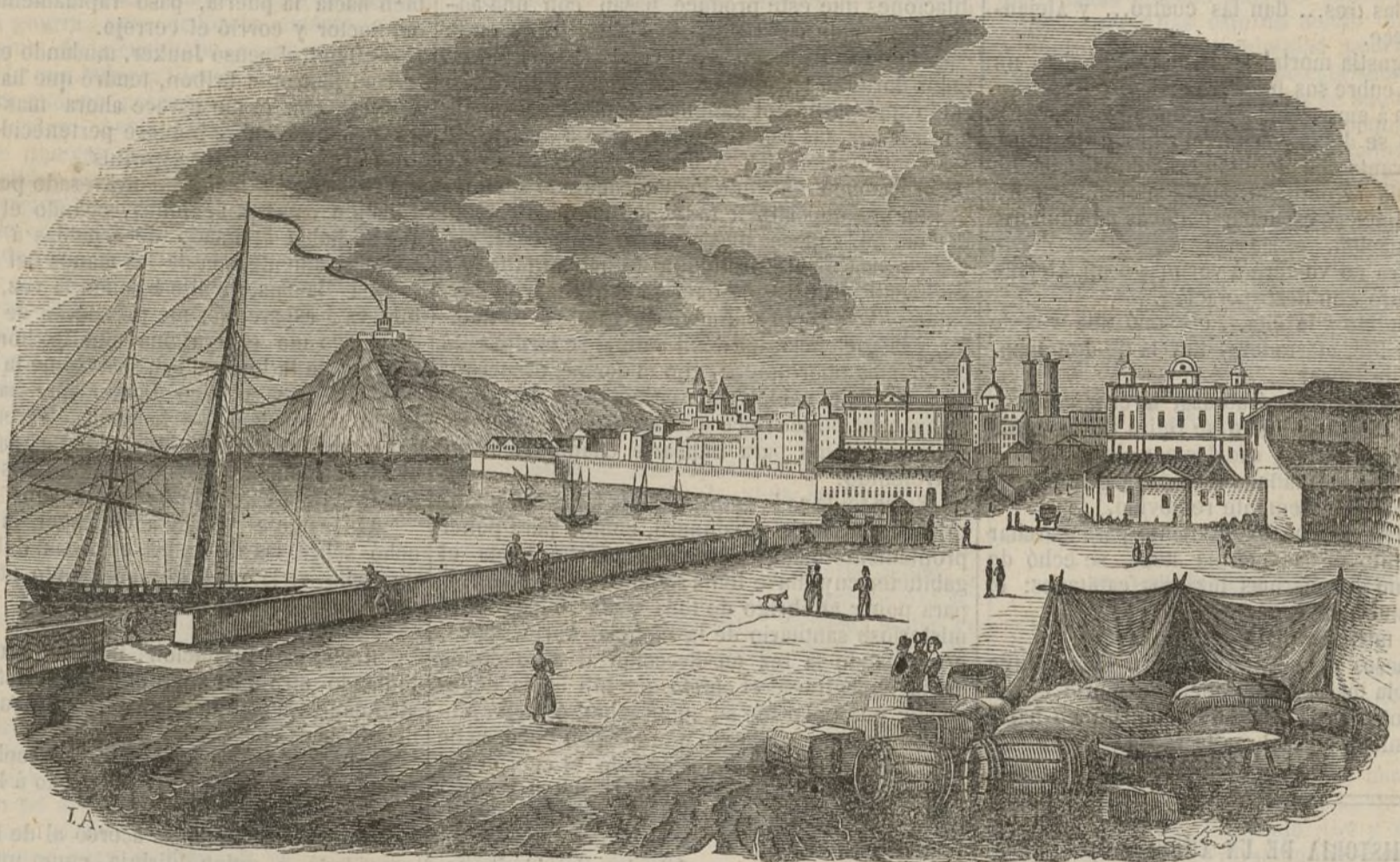
Vista de la ciudad de Barcelona.

La edad de cuarenta años es la mas fatal. Es el punto de la vida en que se hace alto, momento en que el hombre mira con dolor atrás, en que ni es joven ni es viejo; es solo un hombre, cualidad vaga, posicion falsa, estado neutro en que ni puede usar de la licencia que se concede á la juventud, ni goza de los privilegios de la vejez. Las madres por salir de sus hijas consideran á los hombres de esta edad como que les ofrecen todas las garantías imaginables; pero las jóvenes piden otras que no pueden asegurarse, y son de distinto modo de parecer. A los cuarenta años se vuelve gris el cabello, se empiezan á arrugar los ángulos de los ojos, se engruesa el vientre; en una palabra, á los cuarenta años es uno bueno para senador ó redactor de algun periódico ministerial, para jugar en las tertulias al tresillo, y para amar solo á su muger. En fin,