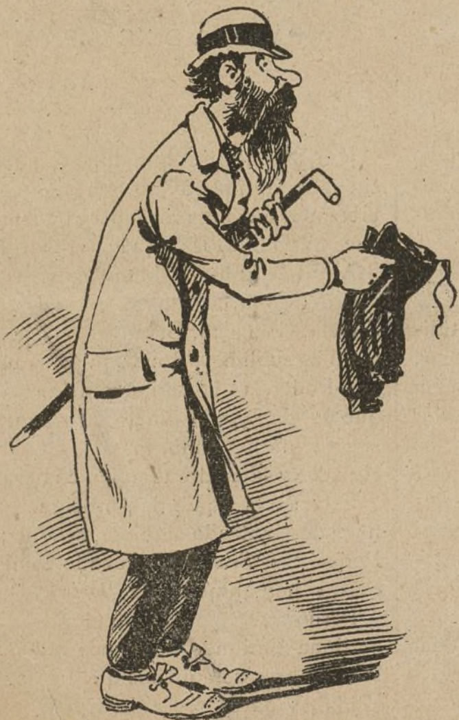
Uno que no quiere decir su nombre. (Y hace bien.) Una gruesa de palillos de pino para los dientes