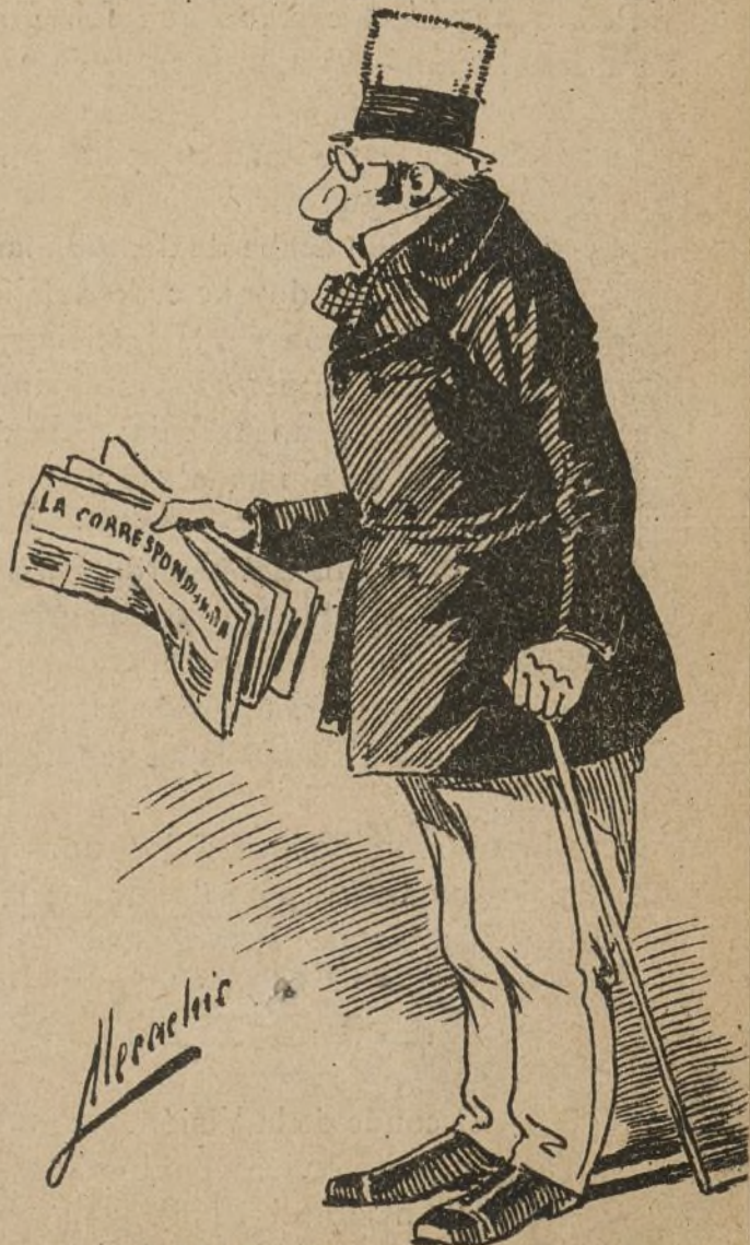
D. M. H. P. Tres números atrasados de La Correspondencia de España. (Queda cerrada la Suscripción).