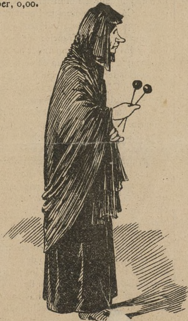
Una Señora viuda de su difunto. Dos alfileres de la