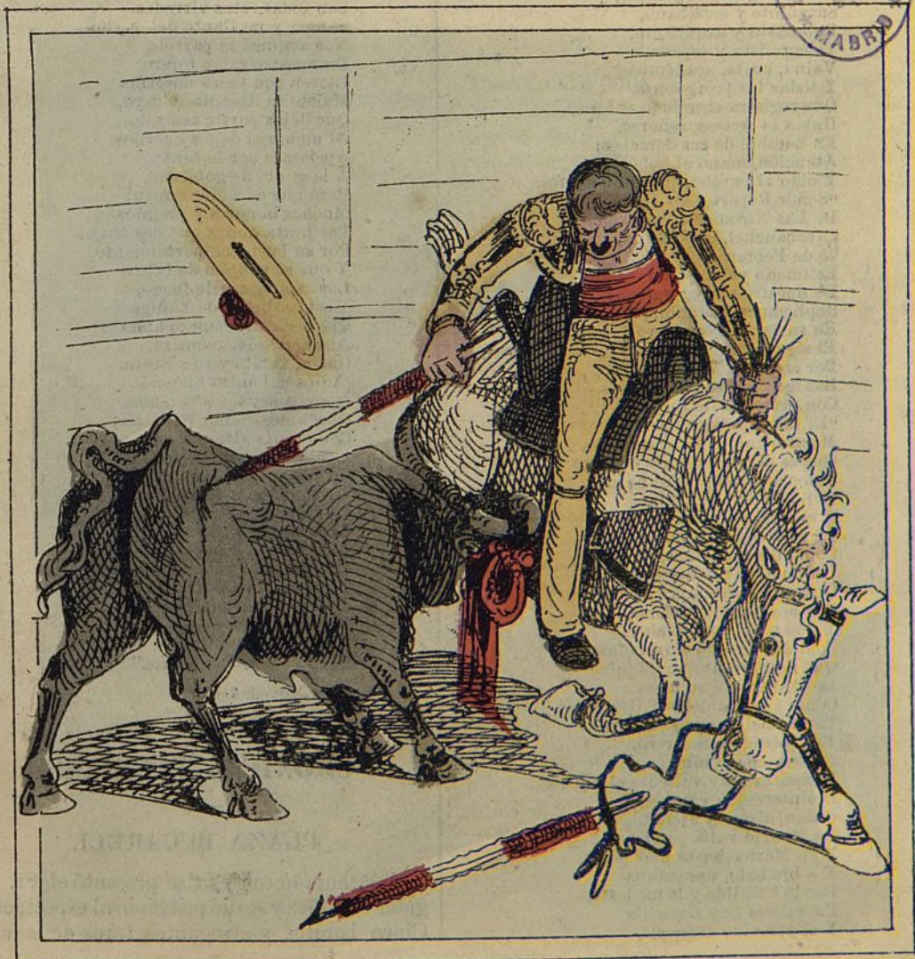
Un charro (P) de nuevo cuño banderillando á caballo,