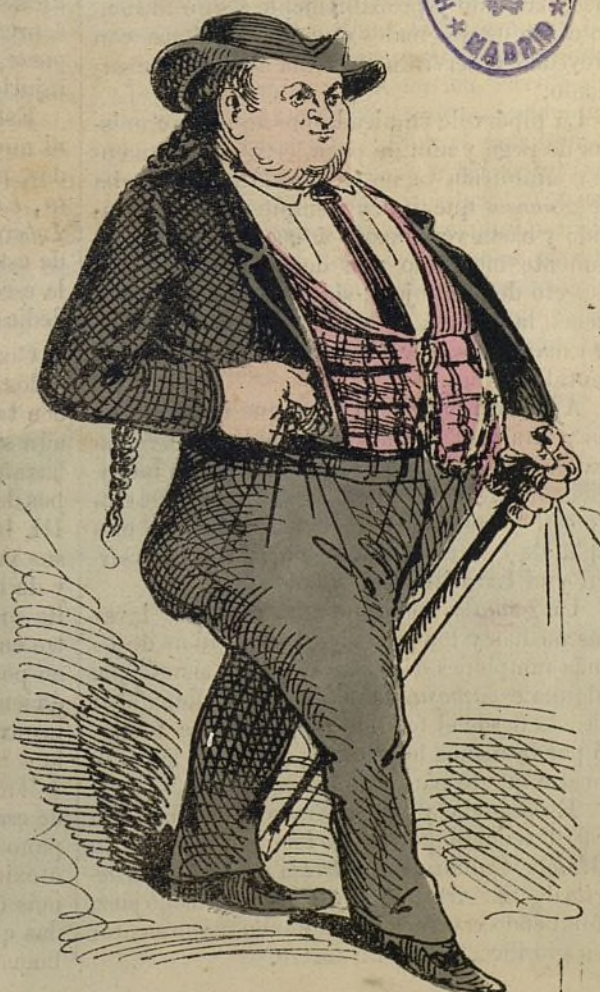
Como se ponen ó se van.