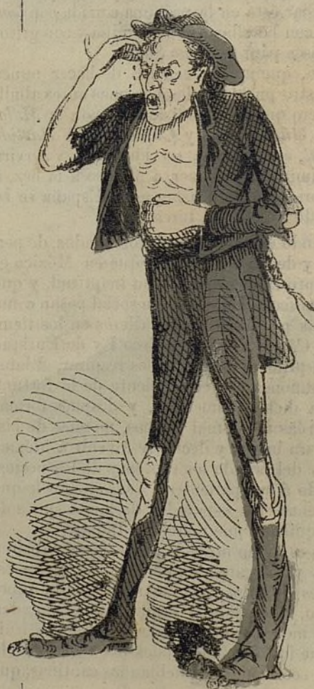
Como vienen.... (casi todos).