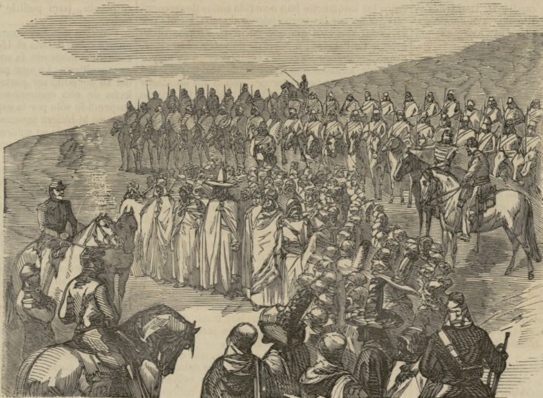
Insurrección de Argel.—Los jefes de los flittas reciben del general Deligny la confirmación del «aman» en el vivac de Ras-Oued-el-Anzar. (Véase pág. 80.)

Practicadas todas las ceremonias religiosas que exigía la etiqueta, el clero de Quiapo, con el párroco más antiguo del Sagrario de la santa iglesia catedral á la cabeza, recibió el cadáver, que conducido en hombros por la marinería de la falúa del capitan general, continuó el acompañamiento á pié por las calles Reales de la Solana, hasta la iglesia de la