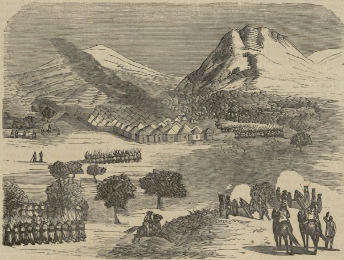
Ataque y toma de la aldea de Diaké, mansion de los Toucouleurs-bantiabés en el Senegal. (Vase pág. 80.)

está á 50 m de elevación sobre el nivel del mar. Esta fortificación defiende á la ciudad, además de otras muchas, de un sitio en regla.