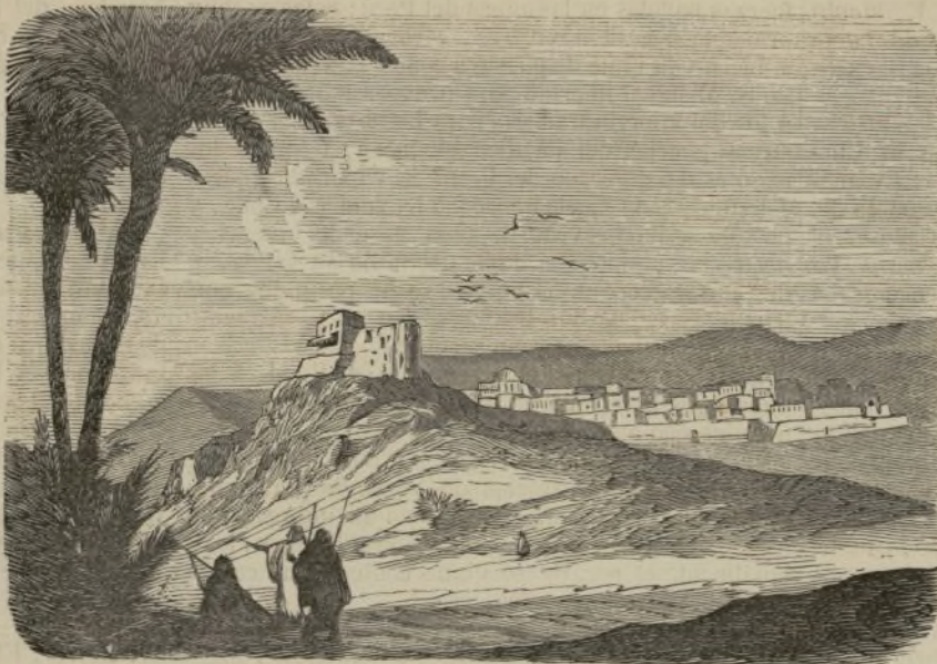
Kzar-Brixina, residencia de los Oulad-Sidi-Cheikh, que produjeron la rebelión de Argel.

Los autores que no quieran revelar su nombre pueden conservar el anónimo, adoptando un lema