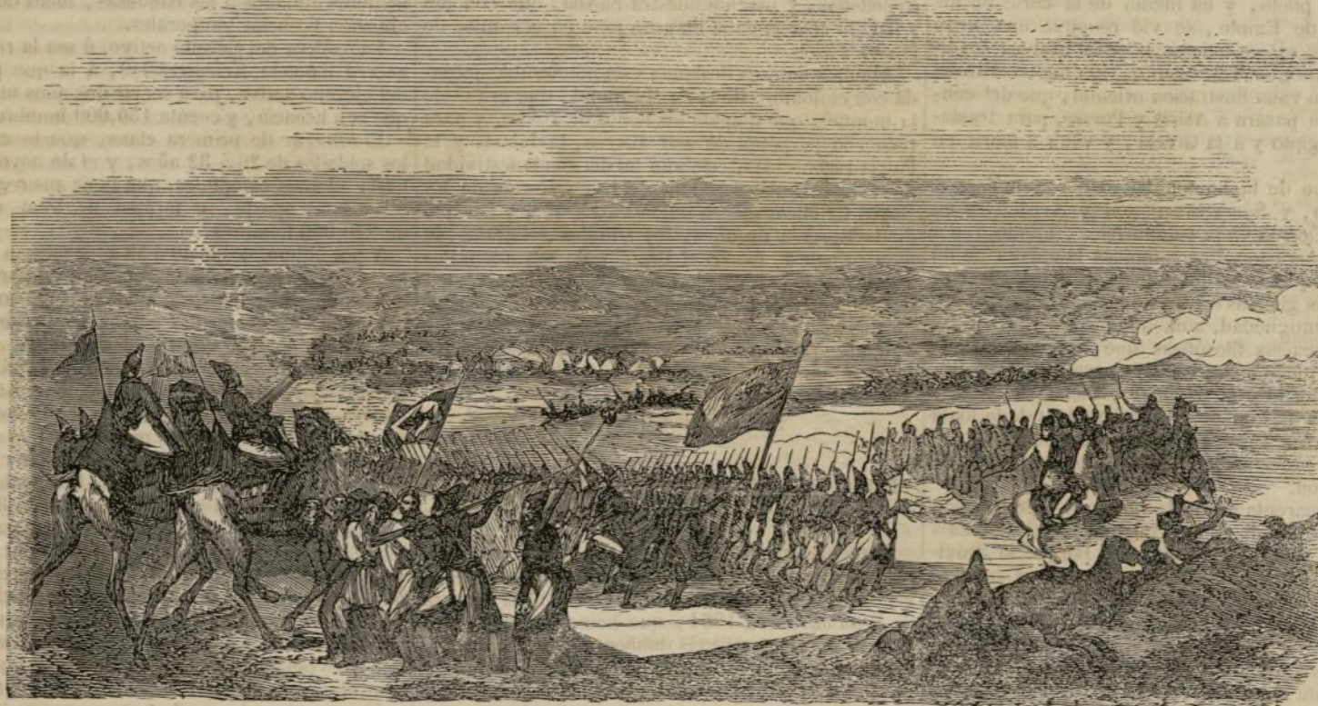
Derrota de los rebeldes de Karakh por el ejército persa. (Véase pág. 128.)

La infantería consta de catorce batallones, de los cuales dos son de cazadores. Cada batallón tiene