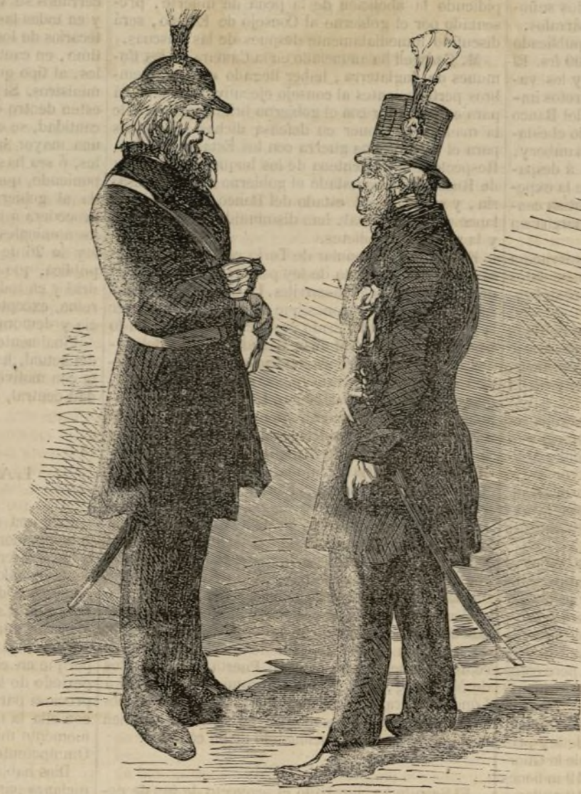
Estados-Únidos.—Trajes de los veteranos americanos en la guerra de 1812. (V. pág. 127.)

Las últimas noticias de Montevideo alcanzan al 13 de Febrero, y por ellas sabemos que aunque la capital del Uruguay ha-