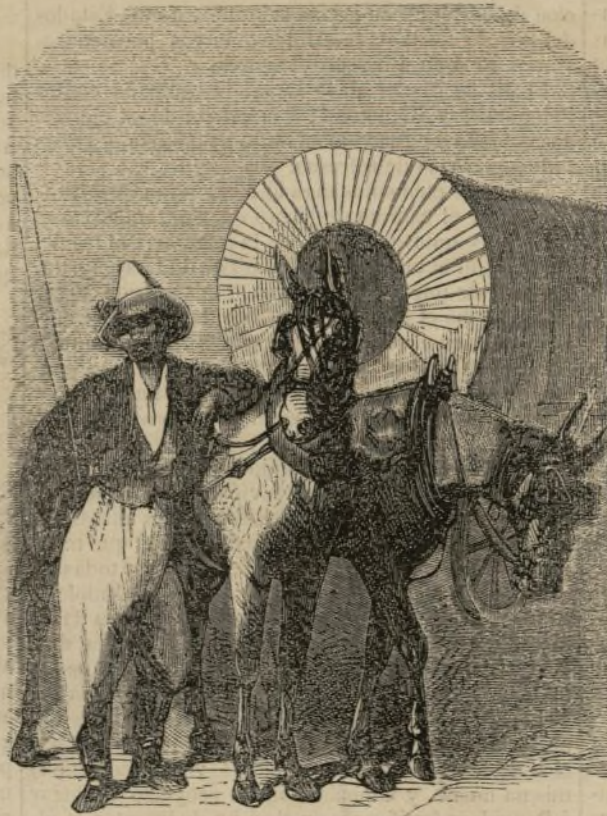
Guerra de los Estados- Unidos.—Negros del tren de equipajes del ejército federal. (Véase pág. 159).

—Ciertamente. Yo presumo que no creerás en esa amenaza; pero sea como quiera, ha despertado en mí la idea de un acontecimiento que, tarde ó temprano, debe llegar.