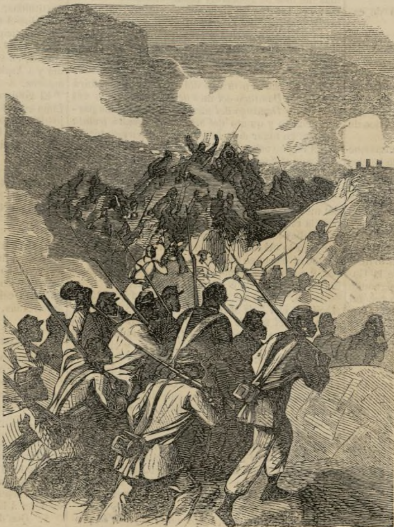
Guerra de los Estados Unidos — Exploradores negros de la división de Weitzel que abrieron la entrada de Richmond. (Véase pág. 159.)

Hasta ahora, desgraciadamente para los ingleses, las amenazas del corresponsal no parecen ser de tal naturaleza que inquieten mucho á Tougso-Penlow, pues las noticias posteriores dicen que, en efecto, se han enviado fuerzas contra el Bhoutan, pero el choque en que se han empeñado no parece haberles sido muy favorable. Y por último, una tercera correspondencia que publica el mismo Times of India , fechada á los quince días de la que acabamos de mencionar, después de hablar de los preparativos de guerra que se hacían en la India inglesa, parecía preveer lo que ha sucedido, y ha sido, cometer la torpeza: 1.º, de enviar contra el Bhoutan un cuerpo único compuesto de indígenas; 2.º, escoger puntos débiles en las fronteras, en vez de atrincherarse en las posiciones más fuertes; 3.º, confiar estos puntos á escasas guarniciones, resultando de todo esto, que el haber elegido una línea débil fronteriza, y encargársela á las tropas indígenas, sería la causa, ya