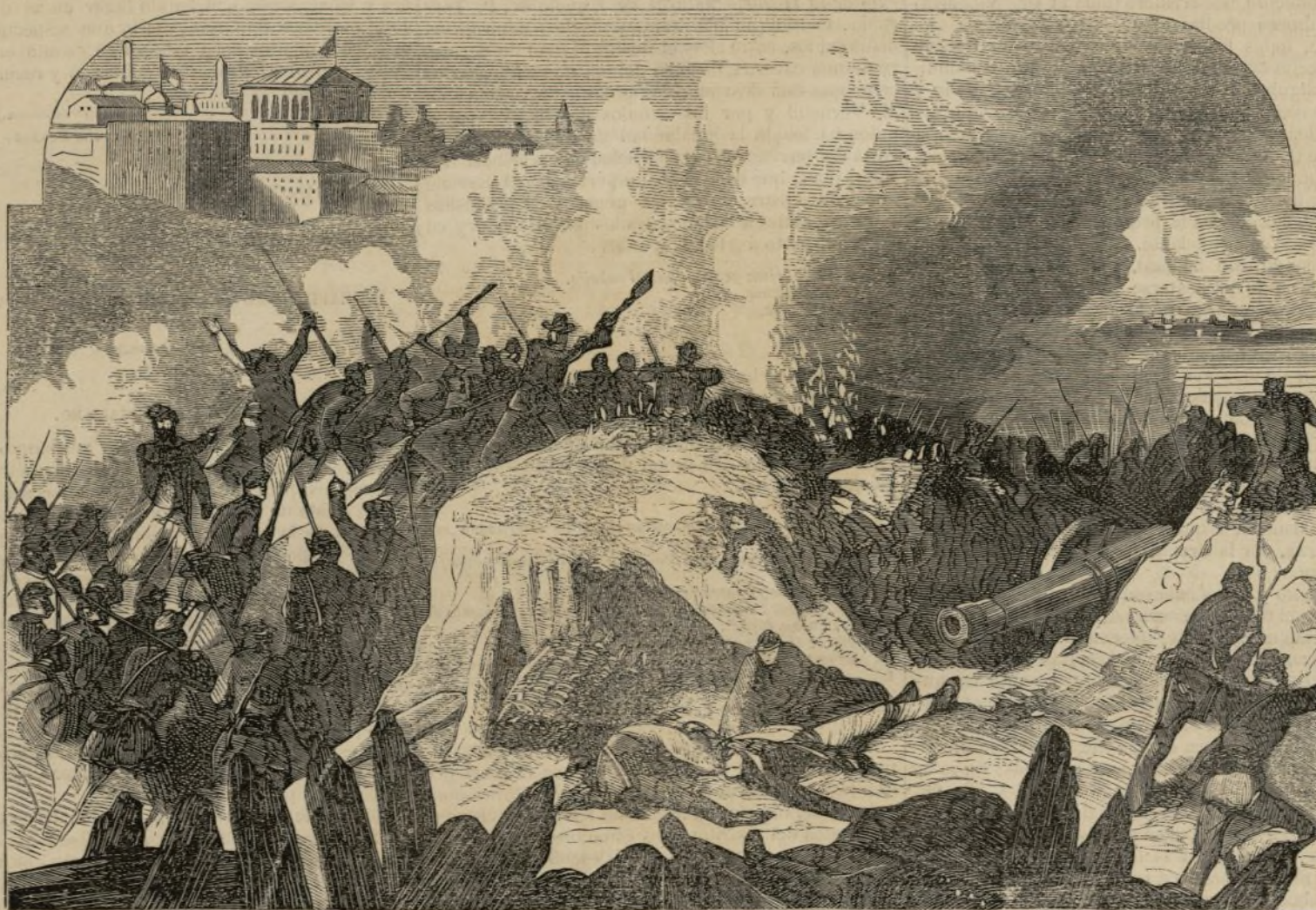
Guerra de los Estados-Unidos.—Toma de Richmond. (Véase pág. 159).

el estudio de los hechos mientras duró el dominio de la filosofía escolástica, se tuvo como axioma el siguiente principio: las ideas son el origen de todos nuestros conocimientos. Y dijo Roscelin: si las ideas son el origen de los conocimientos, serán, sin duda alguna, las ideas generales ó universales, pues las particulares no forman ciencia: las ideas universales no son más que los nombres con que reunimos los fenómenos de un mismo orden, luego estos fenómenos individuales son la base de la ciencia. Los sentidos son los medios por los cuales conocemos la naturaleza sensible, luego de aquí se deduce que los