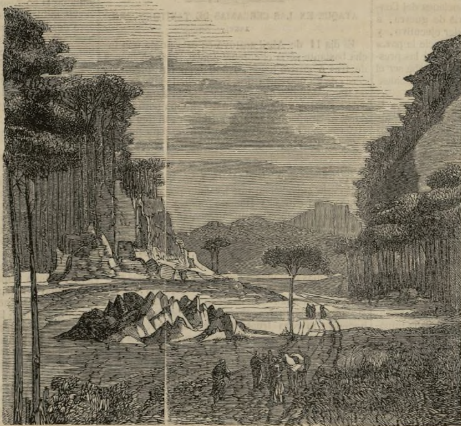
Méjico.—Camino de Mazatlan, sitio llamado los Piloncillos. (Véase pág. 191).

MADRID: 1865.—Imprenta de J. Rodríguez, calle de San Leonardo, núm. 2.