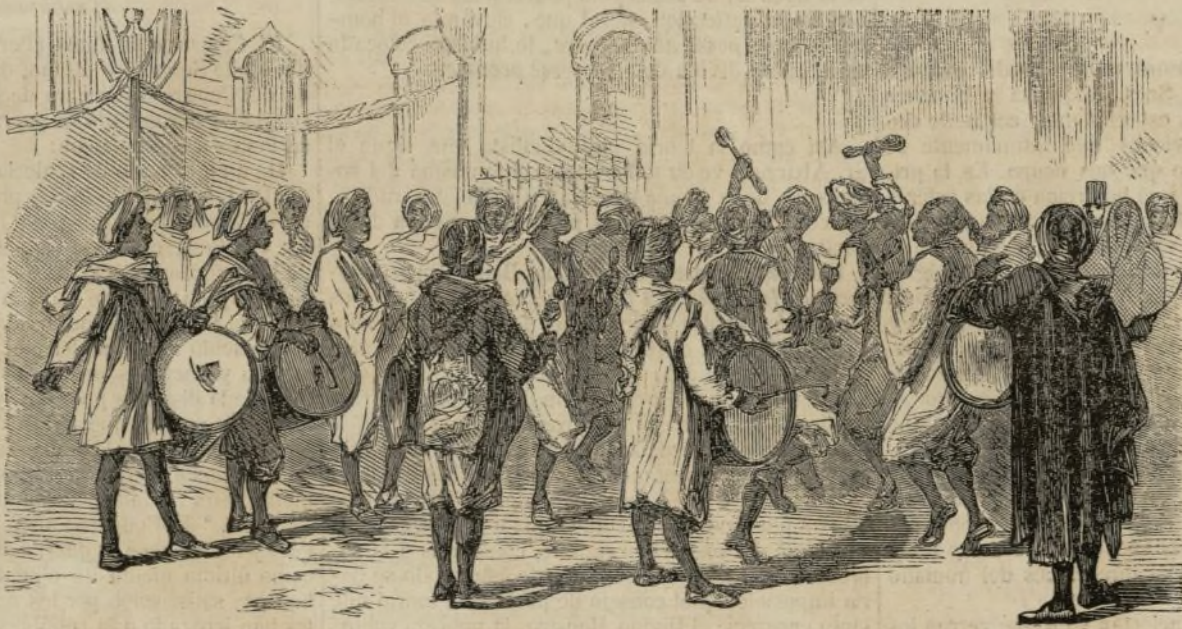
Idem: Danza de negros delante del palacio del gobierno de Argel.