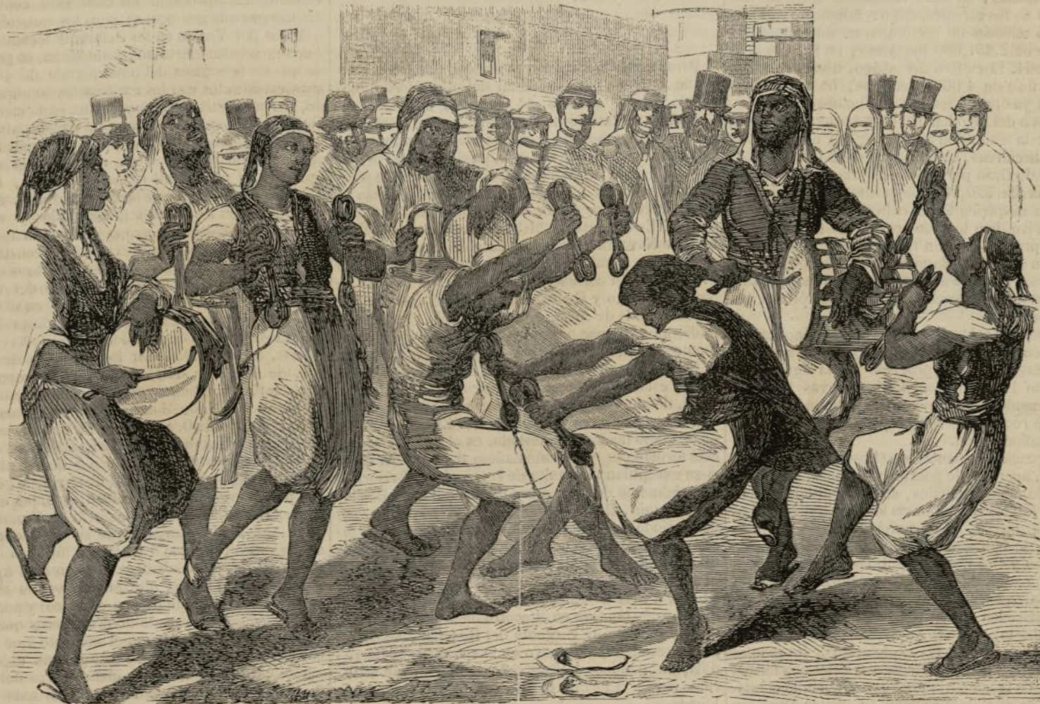
Visita del emperador Napoleon á Argel: Danza nacional en su obsequio.

la más portentosa de todas las verdades absolutas que guian á la humanidad por el sendero de la vida. En la esfera religiosa todas las grandes inteligencias contemporáneas están ya acordes en el problema fundamental: catolicismo ó negacion de toda religion positiva, considerando que la verdad moral puede vivir sin conocer la verdad religiosa, ni la verdad metafísica. Y entiéndase, que el catolicismo es cristianismo, y que esta ley moral que se quiere alzar sobre las ruinas de todas las religiones y de todas las filosofías, no es otra cosa que el ideal cristiano despojado de sus divinos esplendores y reducido al concepto del soberano bien concebido, y