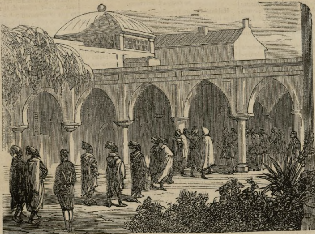
Viaje del emperador Napoleon III á Argelia.—Llegada de la embajada marroquí á Chateau-Neuf (Oran) para ser recibida en audiencia solemne. (Véase pág. 207).

MADRID: 1865.—Imprenta de J. Rodriguez, calle de San Leonardo, núm. 2.