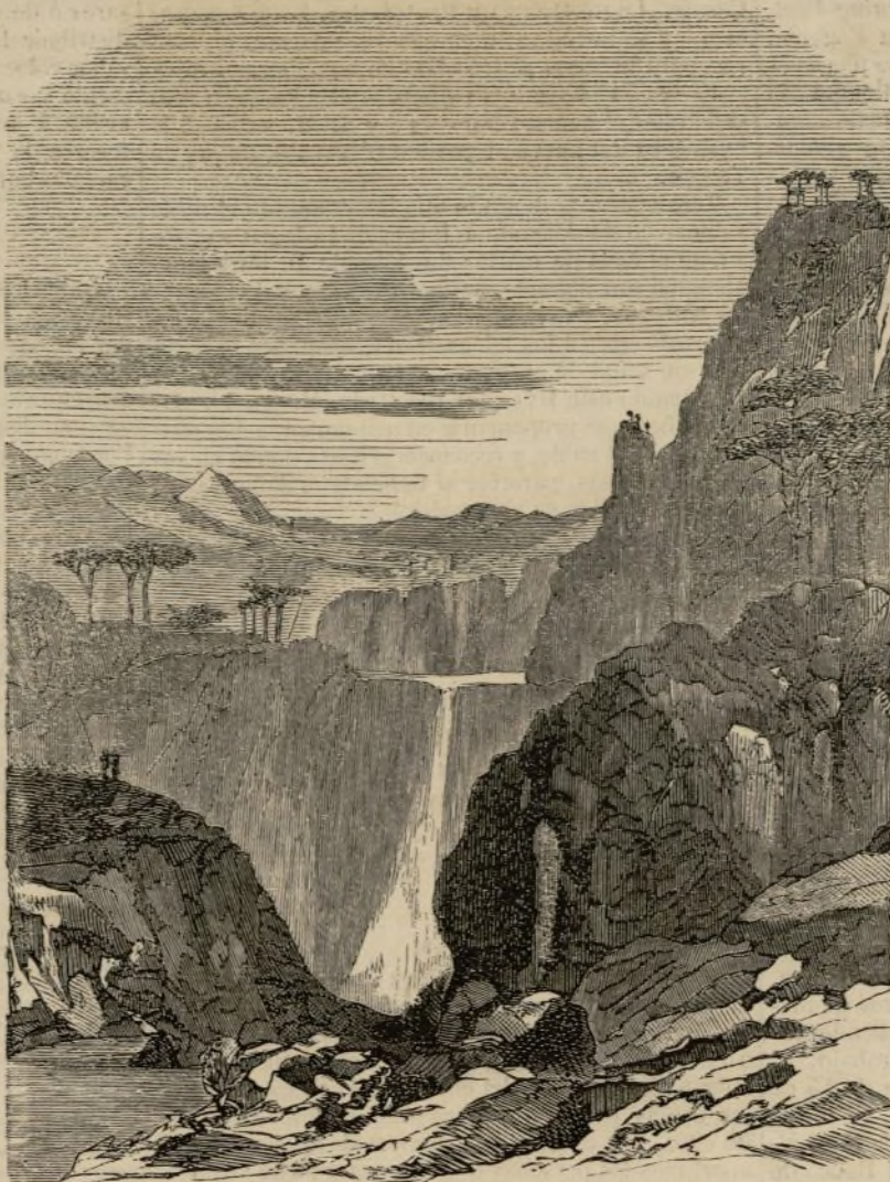
Guerra de Méjico.—Expedición á Sinaloa, camino de Mazatlan, cascada de Rio Salto.

Los de Nápoles decian que durante la procesion del Corpus habian gritado ¡Viva la religion! y ¡Viva Cristo! los partidarios de la reaccion, reunidos en un grupo de más de 400 personas, que fueron perseguidos y dispersados, llegándose á hacer algunas