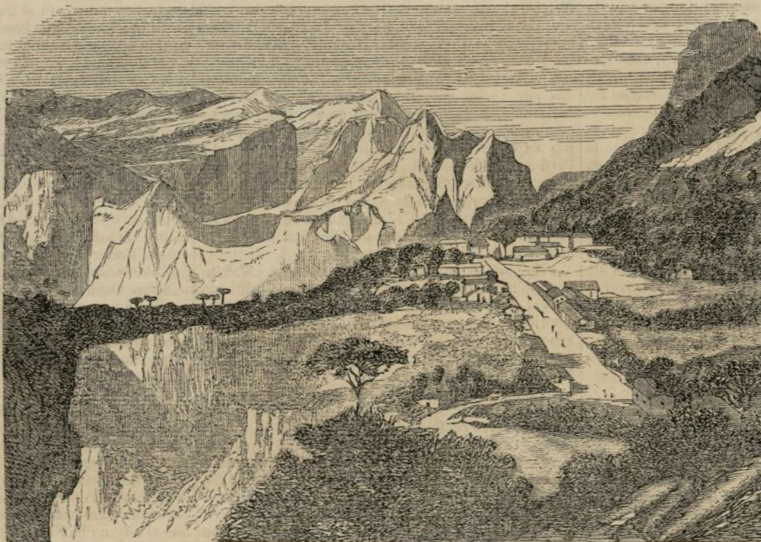
Guerra de Méjico.—Expedicion á Sinaloa: camino de Mazatlan, Sierra Madre, Durasnito. (Véase pág. 191.)

Los sectarios de Hegel entienden por racional la negacion de todo lo sobrenatural, y por real, la negacion de todo lo que no se puede contar y pesar, la negacion de lo invisible. Así aparecen en el sistema de Hegel las tres grandes negaciones que há poco mencionamos: se niega á Dios en nombre de la negacion racional de lo sobrenatural; se niega la materia por su variedad fenomenal en nombre de