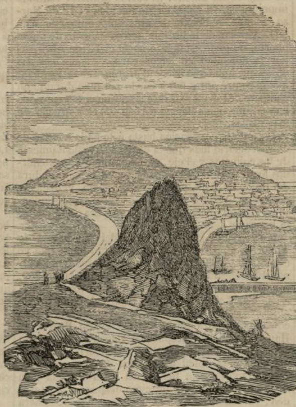
Guerra de Méjico. — Mazatlan y sus dos puertos.