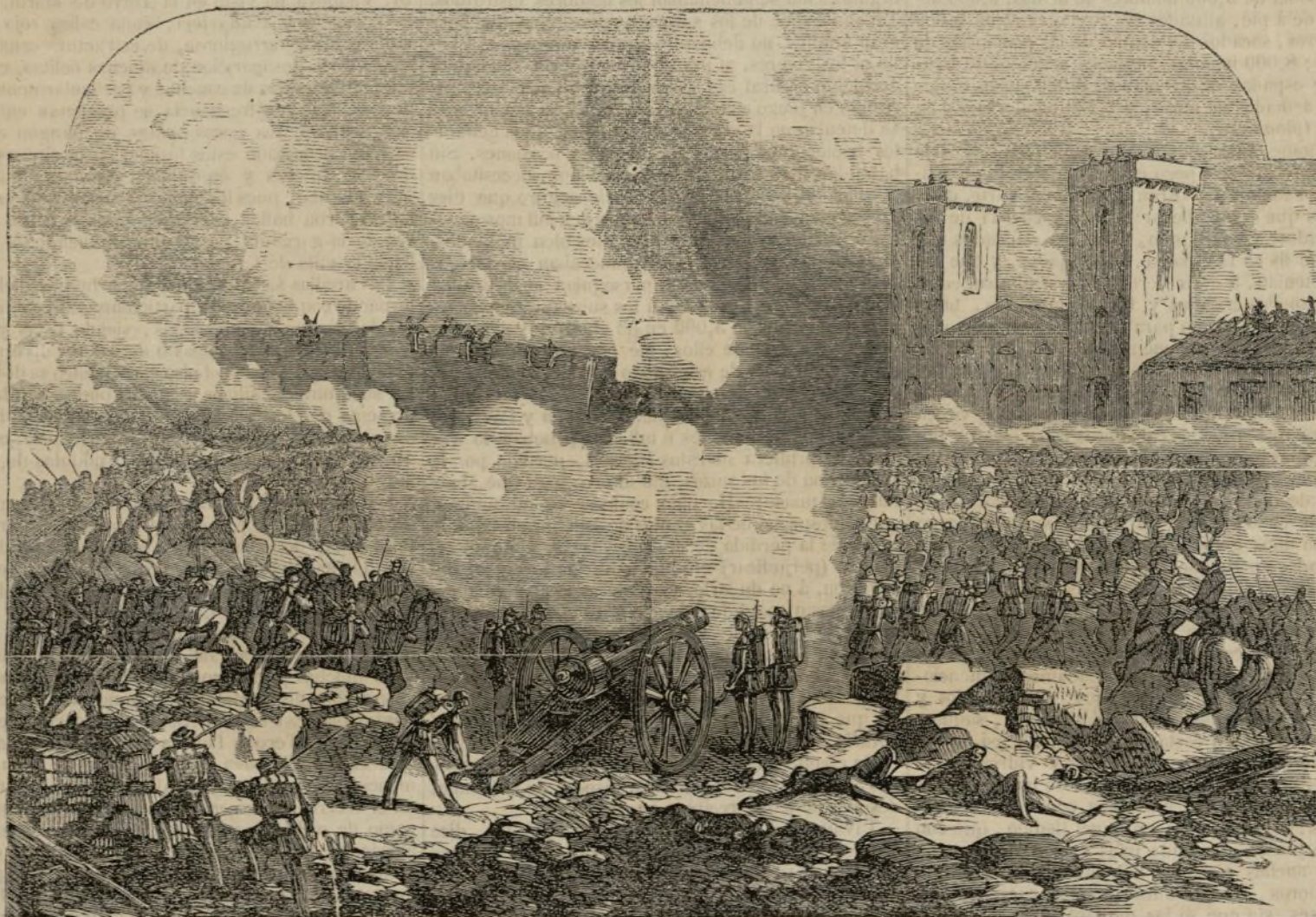
Guerra del Brasil y del Uruguay — Toma de Paysandú.

En los mencionados criaderos existen también las variedades conocidas con el nombre de azabache,