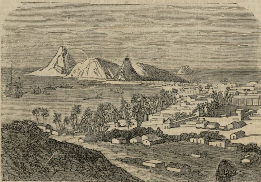
Guerra de Méjico. —Vista general de Mazatlan. (Véase pág. 216).

El idealismo .—El deber y el derecho son absolutos, según una idea racional que los funda.