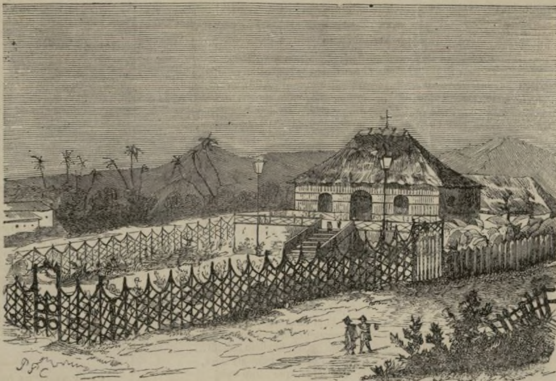
Islas Filipinas.—Casa de Aguada en Manila.

Al quitar el pavimento de otra de las habitaciones que forman este laberinto, entre la tierra y junto á la roca viva se encontraron confundidos restos de vigas quemadas, cenizas, osamentas de cuadrúpedos y de aves, algunos huesos, al parecer humanos, y gran cantidad de tiestos y vasijas de un barro grosero, que sin duda pertenecerán á alguna de las primeras colonias que aportaron á estas costas, y se estableció en la colina de Tarragona en épocas remotísimas y desconocidas.