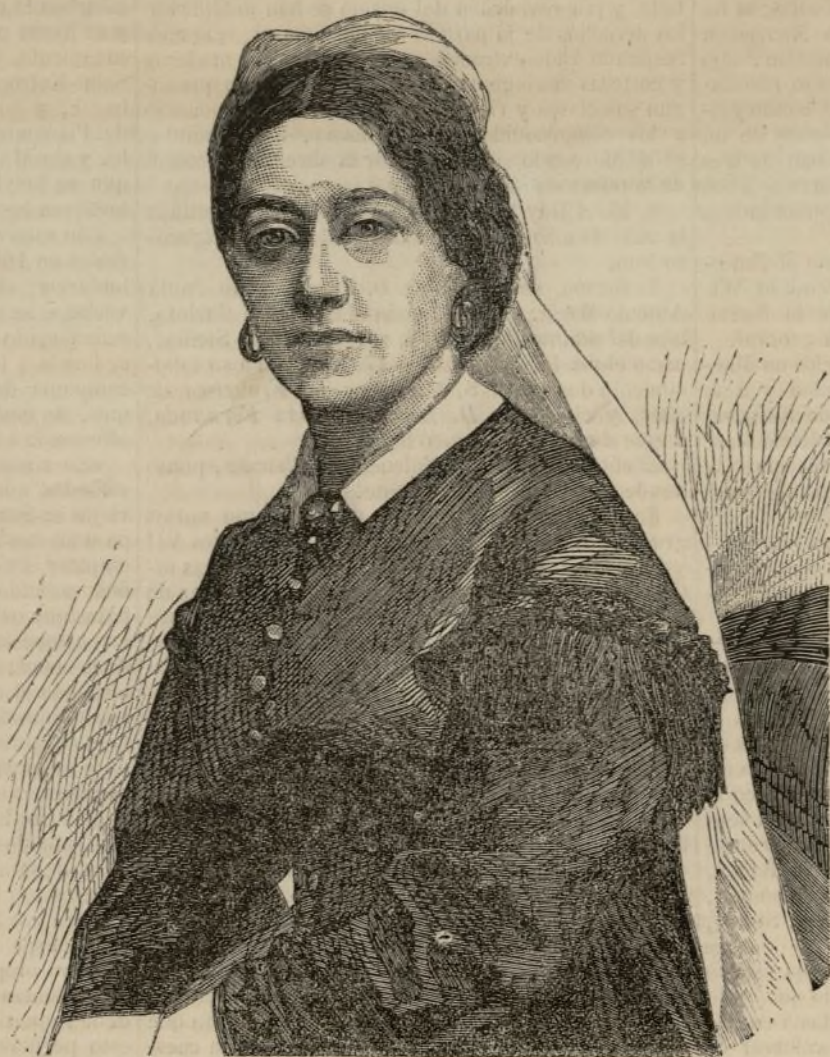
La reina viuda Emma, de las islas de Sandwich. (Véase pág. 279).

En Egipto se ha celebrado este año la fiesta de 15 de Agosto con gran entusiasmo; pero la noticia más importante ha sido la recibida de Ismaila, anunciando haberse abierto las esclusas del canal