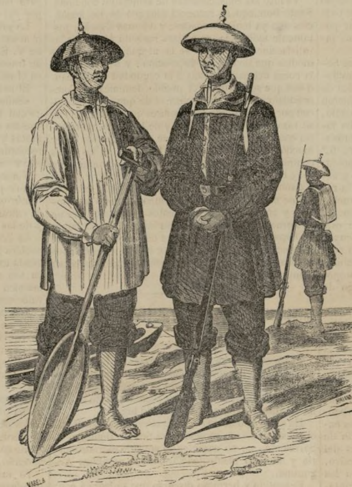
Tipos de soldados del ejército filipino.

Pero no se limita á este solo punto, en el que