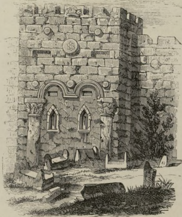
JERUSALEN.—PUERTA DE ORO POR DONDE ENTRÓ JESUCRISTO VINIENDO DE BETHANIA, DESPUES DE RESUCITAR Á LÁZARO. (De nuestro corresponsal y dibujante D. F. Reinhard.)