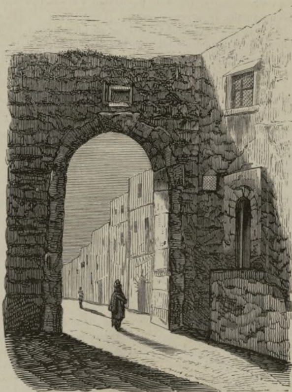
JERUSALEN.—CASA DE LA VERÓNICA EN LA VÍA DOLOROSA.

para que antes de su muerte se viese privado de todos los elementos.»