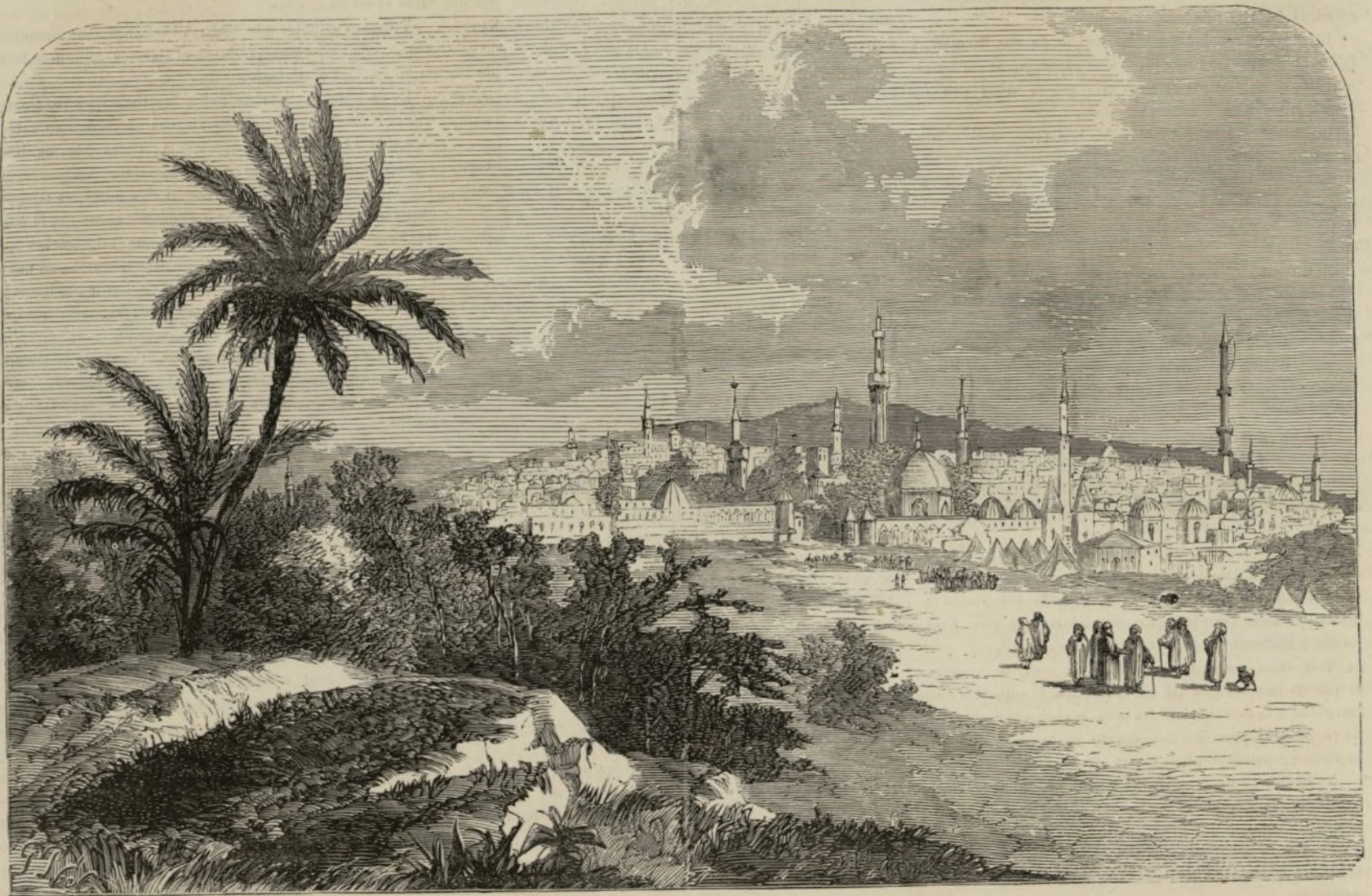
SIRIA.—VISTA GENERAL DE DAMASCO.

Nada hay que distinga y aparte mas los tiempos antiguos de los modernos; la barbárie de la civilización; las nacio-