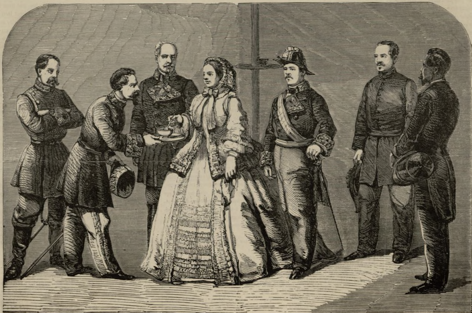
CAMPAMENTO DE TORREJÓN DE ARDOZ.—S. M. LA REINA, ACOMPAÑADA DE SU AUGUSTO ESPOSO, PRUEBA EL CALDO QUE SE SUMINISTRABA Á LOS ENFERMOS EN UNA TIENDA, HOSPITAL DEL CAMPAMENTO.

Texto. Crónica de la semana: exterior é interior.—Penas y suplicios.—Shakspeare.—Historia del origen y progresos de la arquitectura naval.—Teatros.—Suelto.—Importante.—Condiciones de la suscripcion.