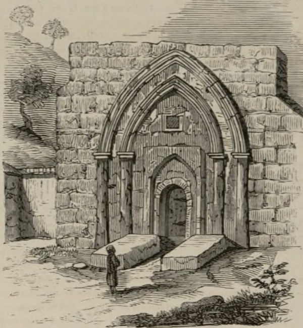
ENTRADA Á LA TUMBA DE LA VÍRGEN, SAN JOSÉ Y SANTA ANA EN EL VALLE DE JOSAFAT.

Los persas fueron los primeros que aplicaron en los tiempos antiguos ese atroz suplicio de desollar vivos á los criminales. Herodoto cuenta que Cambyses hizo desollar vivo á un Juez prevaricador llamado Sisamnés, y con la piel mandó forrar la silla en que se sentaba para