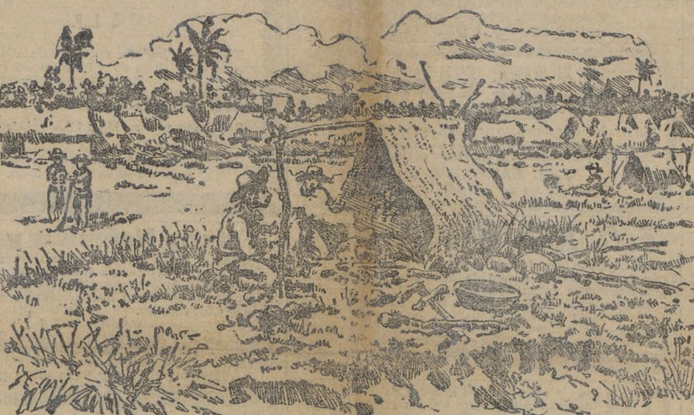
CUBA.—Avanzadas del campamento de una columna en operaciones.

Aseguran que la contestación llegó ayer tarde y que Sagasta se niega a convertir en base de discusiones diplomáticas las opiniones de Dupuy consignadas en una carta particular que en nada afecta a la esfera de los compromisos oficiales.