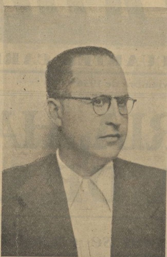
Delegado Responsable de Abastecimientos

Colocado en la lucha revolucionaria, desde los primeros momentos fué uno de nuestros adalides más corajudos, y hoy, al frente de las Oficinas de Reclutamiento de nuestro Cuartel, muestra toda su capacidad organizativa admirable.