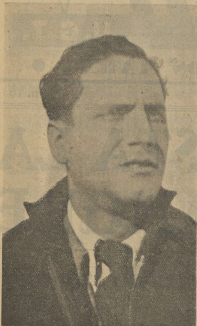
Delegado Responsable de Reclutamiento

Formado desde muy niño en nuestras Juventudes Socialistas, su temple marxista es de los que no aceptan fáciles quiebras ni situaciones acomodaticias.