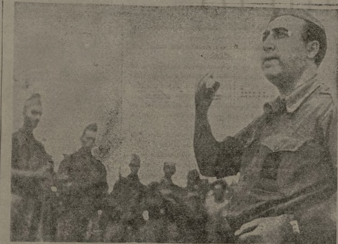
La voz del comisario, serena y oportuna, expone ante los soldados el objetivo de nuestra lucha y su significación clasista.

Pero nuestros soldados se saben de corrido su papel y tienen ya la experiencia suficiente para dar un quiebro de cintura a la bala certera de los guardias civiles y de los rifones. Los ojos fríos saben ya descubrir con fina sensibilidad los más pequeños movimientos del enemigo. Y cuando la bala surge del fusil de enfrente ya están nuestros soldados fuera de la línea de tiro. Y