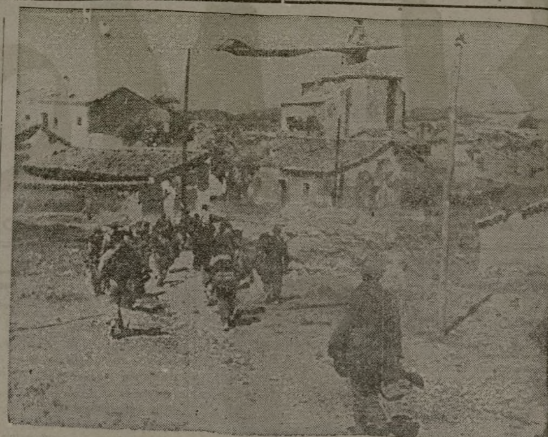
Entrada a un pueblo conquistado por las fuerzas del Ejército republicano. Como este, muchos caerán ante el empuje y la aco metividad de los heroicos soldados leales.

Los trabajadores españoles, que han seguido anhelosamente la marcha de nuestro Ejército por la provincia de Madrid, ansían conocer en su más mínimos detalles — dentro, naturalmente, de la discreción obligada — el comportamiento de cada una de nuestras unidades, los hechos concretos en que han intervenido y las hazañas que en superación constante han realizado. Es un justo afán de las masas populares; un justísimo afán. Creemos que las disposiciones prohibitivas dadas a este respecto tienen una eficacia extraordinaria cuando esos hechos de guerra tienen un carácter actual y cuyo conocimiento público puede influir, lógicamente, en el desarrollo posterior de las operaciones. Pero una vez pasada aquella situación de actualidad, es conveniente permitir que el pueblo sepa el magnífico comportamiento de sus héroes. Nosotros esperamos que los organismos correspondientes atenderán este justo deseo de los antifascistas.