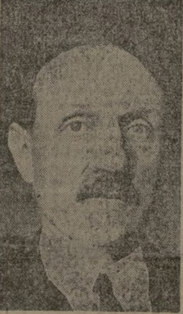
Chautemps, presidente del Gobierno francés, intérprete, por su cargo, en unión del ministro de Negocios Extranjeros, de los acuerdos del Gabinete en materia internacional

Parece que Francia se decide a revisar, con un sentido inteligente de la actualidad, toda la política absurda—absurda, aunque cargada de buena voluntad republicana—que ha seguido, durante un año larguísimo, con relación a España. Nos felicitamos de ello, al mismo tiempo que felicitamos también a Francia, a quien interesa tanto como a nosotros—por lo menos—que se le corten las alas a la injerencia de Mussolini en la Península. Se ha dicho hasta la saciedad—lo han dicho, sin demasiados rebozos, ellos mismos—que lo que los países fascistas hacen ahora sobre España no es sino un tímido ensayo general con vistas a Francia. "Hoy en Sevilla, y Mañana en Toulouse"—dicen con patriótico regocijo por