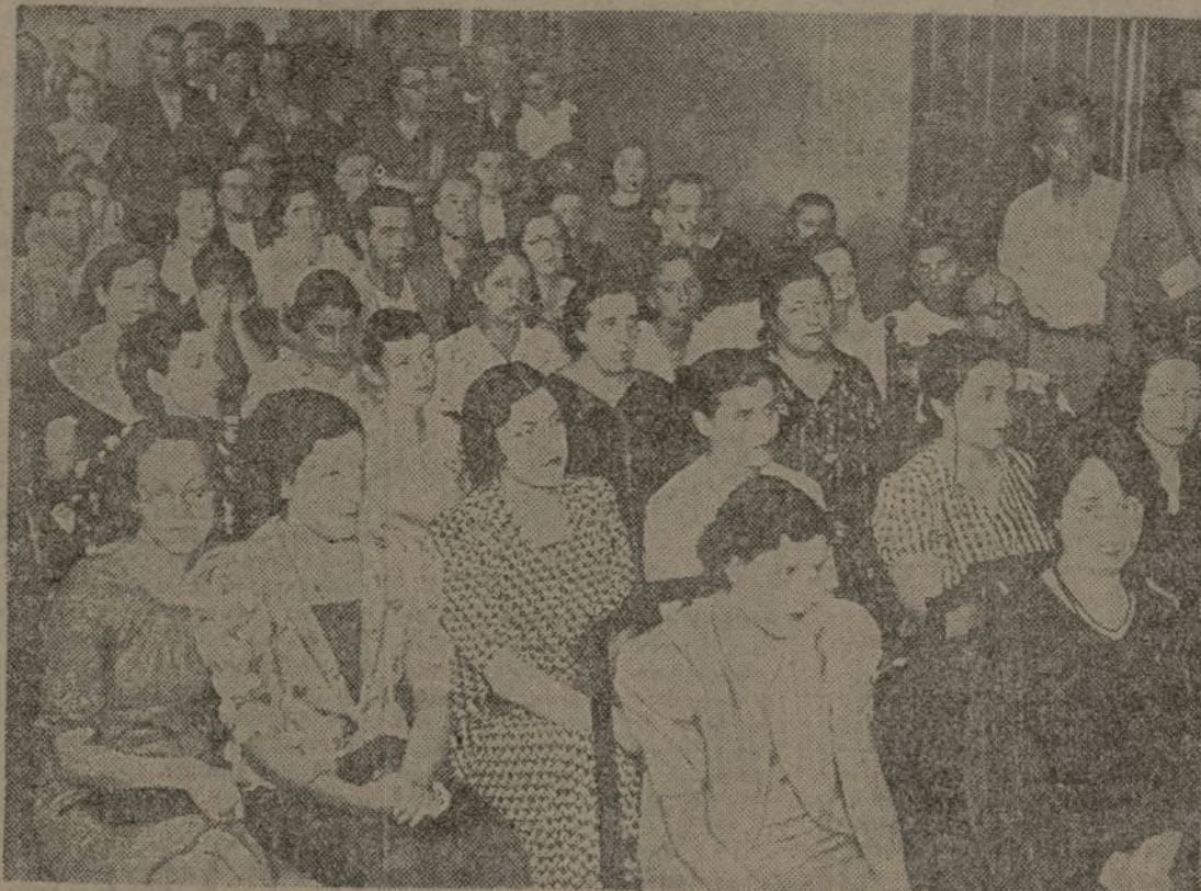
Un grupo de asistentes a la inauguración, efectuada ayer, del magnífico Club que los obreros ferroviarios han abierto para fomentar las relaciones entre los trabajadores antifascistas, en la calle de Velázquez.

Ayer se inauguró en Madrid un nuevo Club. No se trata de un club de la clase obrera, sino de uno de los que no tienen nada que hacer fuera de doblar