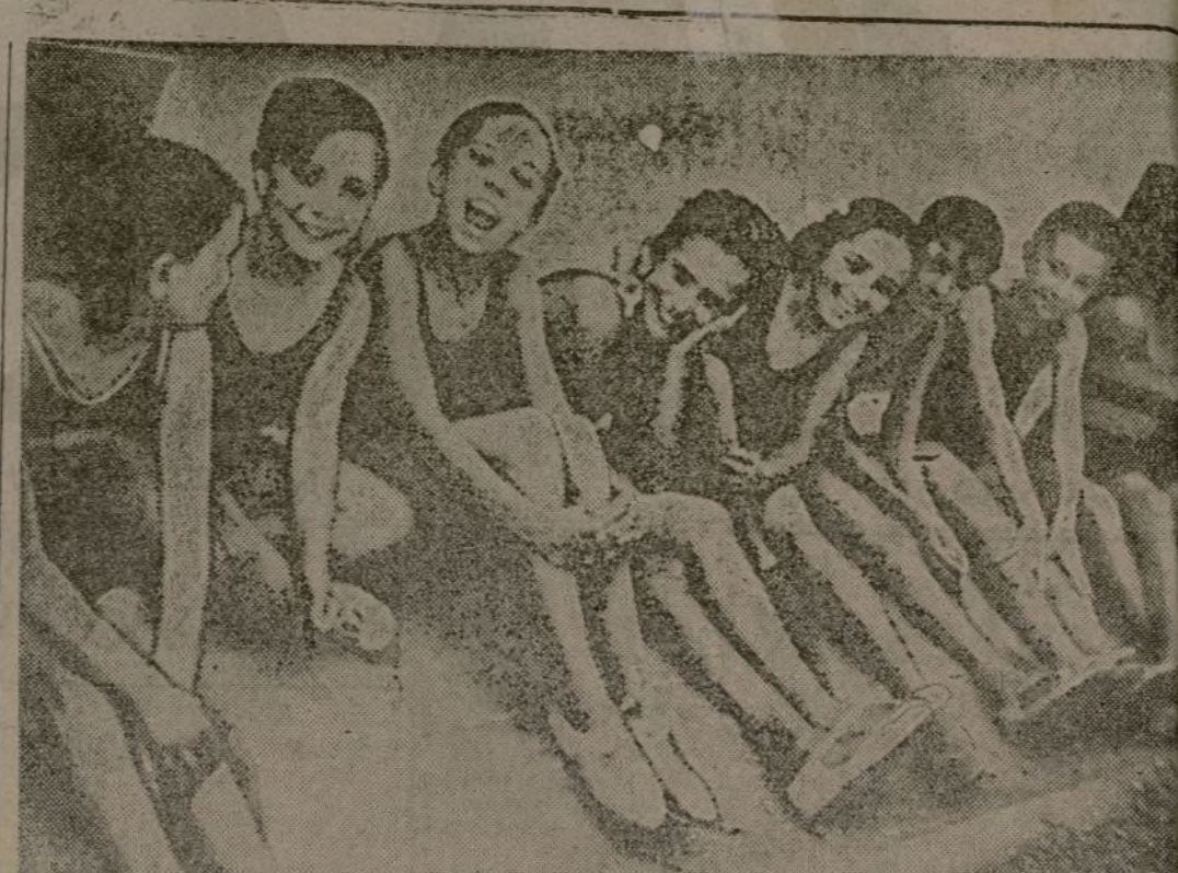
Los niños de las escuelas madrileñas no han perdido la gracia ingenua de su sonrisa, a pesar de los reiterados ataques de la artillería extranjera, al servicio de la traición. Vedlos aquí dispuestos a zambullir el cuerpo en una piscina durante las horas de recreo entre clase y clase.

PARIS 2 (9 m.).—En los círculos diplomáticos de esta capital circula con insistencia el rumor de que Francia ha decidido renunciar al control naval de las costas españolas, lo que ha producido un intenso cambio de impresiones entre el Quai d'Orsay y el Foreign Office. (Argos.)