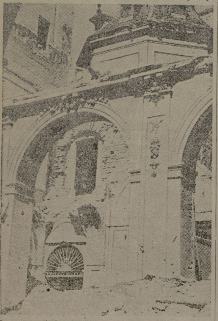
Los que se titulan defensores de la religión tienen en Madrid, como en Guernica, objetivos religiosos, que buscan ávidamente sus bombas destructoras. He aquí los restos de la iglesia de San Sebastián después de "una defensa" de los defensores del catolicismo

La flota civil aérea estará formada por 28 de los más modernos aviones de línea y tendrán capacidad para transportar un total de 800 pasajeros. La velocidad media de estos aviones comerciales será de 200 millas por hora.