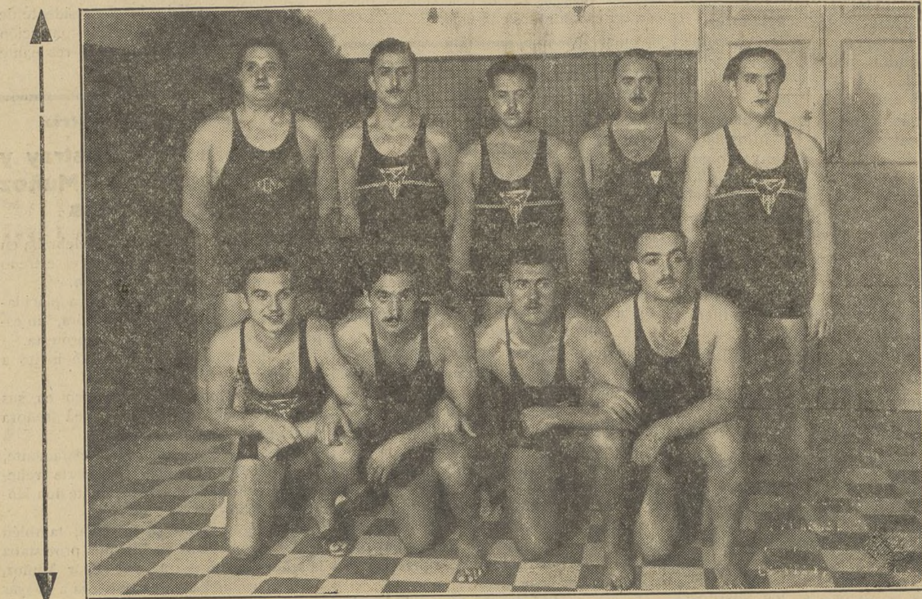
Mañana en la piscina Nunca habríamos llegado a exponer que un cuadro de la clase y potencia del C. N. Barcelona, había de asomarse al ventanal de la Prensa oscense con motivo de su visita a Huesca. Sin embargo, así ha ocurrido. Los atletas que aquí ustedes ven son internacionales y representando los gloriosos colores de su Club han marcado el siguiente itinerario: París, Lyon, Marsella, Barcelona, Huesca.