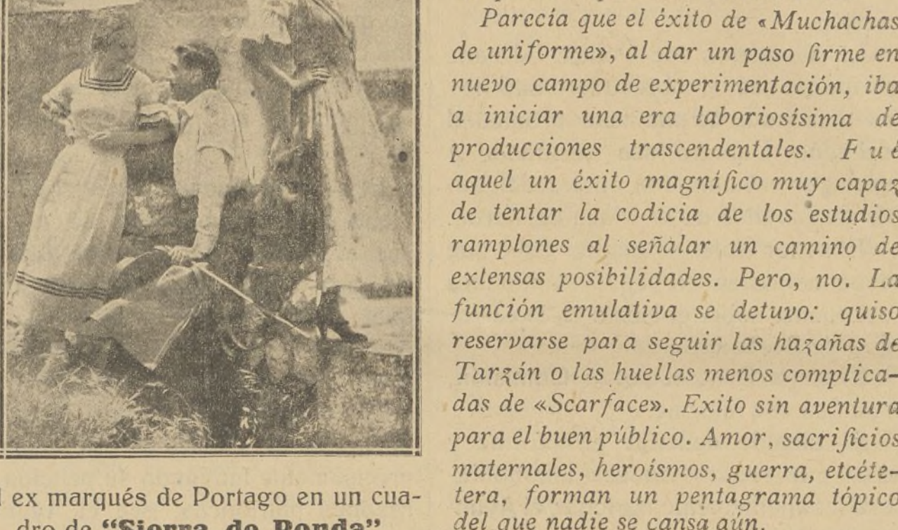
El ex marqués de Portago en un cuadro de "Sierra de Ronda"

Una sola faceta del cinema no ha merecido el fervor emulativo de los productores: el cinema de tesis, de concepción doctrinal, de nervio social o psicológico. El alegre desenfado de las casas productoras se ha detenido, agobiado ante la perspectiva de este cinema peligroso. No se atreven a proseguir esta ruta que implica una formidable capacidad creadora y técnica de que no disponen habitualmente para confeccionar sus nutridos stocks estúpidos de películas mercantiles.