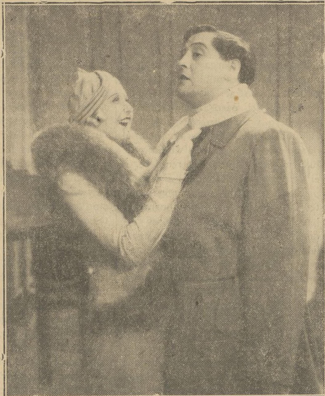
Una escena de "Tenor de cámara"

Fué en un garage de mi padre donde comencé a trabajar con un material compuesto de un viejo aparato fotográfico y de una pequeña provisión de tinta y de papel. Después he llegado a tener