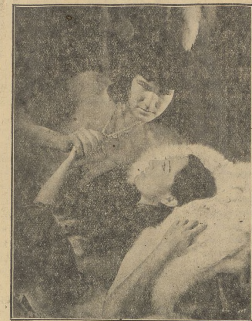
Un cuadro de «Esquimo», interesante film polar

Abunda en nuestro país una plaga inextinguible de ciudadanos que vegetan placidamente en sitios tan típicos y descansados como son los divanes de cafés, donde hacen diario repaso de los temas—nacionales, internacionales y de las regiones celestes—de actualidad palpitante, que son puestos a discusión en cada «pequeño parlamento», y enseguida surgen de los contertuleos mil fórmulas que ofrecen otras tantas adecuadas soluciones a los asuntos debatidos.