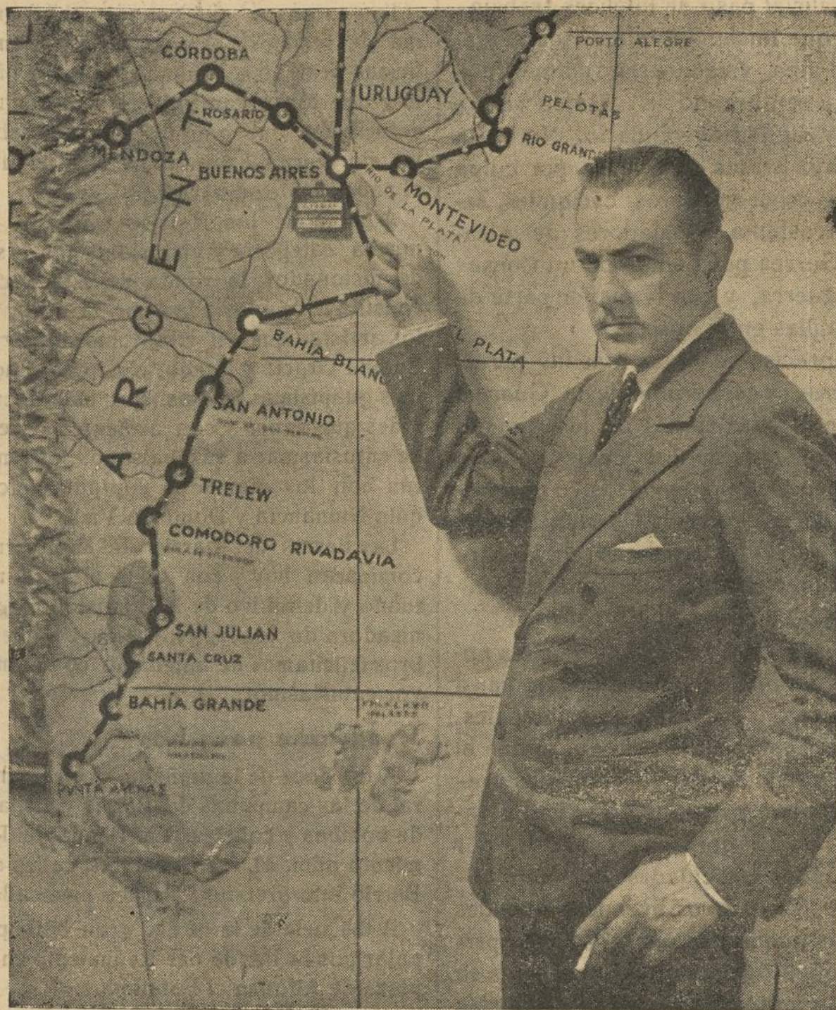
Jonh Barrymore en una escena de «Vuelo Nocturno»

El cine amateur catalán acaba de ser objeto de una distinción honrosísima que prueba la evidencia magnífica de competencia y de su calidad. En la Exposición Biental Internacional de Arte, que acaba de celebrarse en Valencia, la Federación catalana del cinema amateur, ha