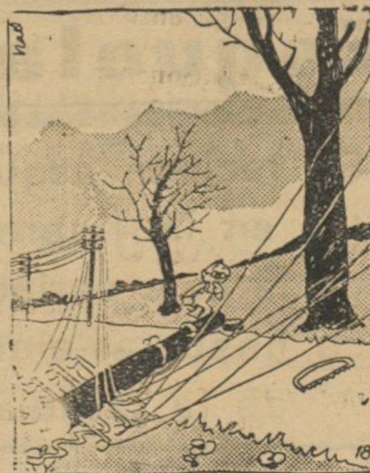
Panorama.-Acaban de pasar el señor Cid y el señor Jalón.

A las seis y media se reciben noticias dando cuenta de que el ministro llegará a Huesca a las ocho de la noche, siendo recibido por las autoridades, entidades y Corporaciones en la Diputación provincial, en donde tendrá lugar una recepción oficial.