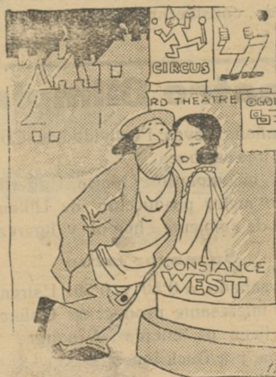
La del cartel.—Este manguán ha confundido las letras. Se arrima pensando en la Z.