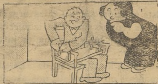
El funcionario.—Está tranquila. Yo me atorullo y a ver quién es el Gil guapo que me provisionaliza.